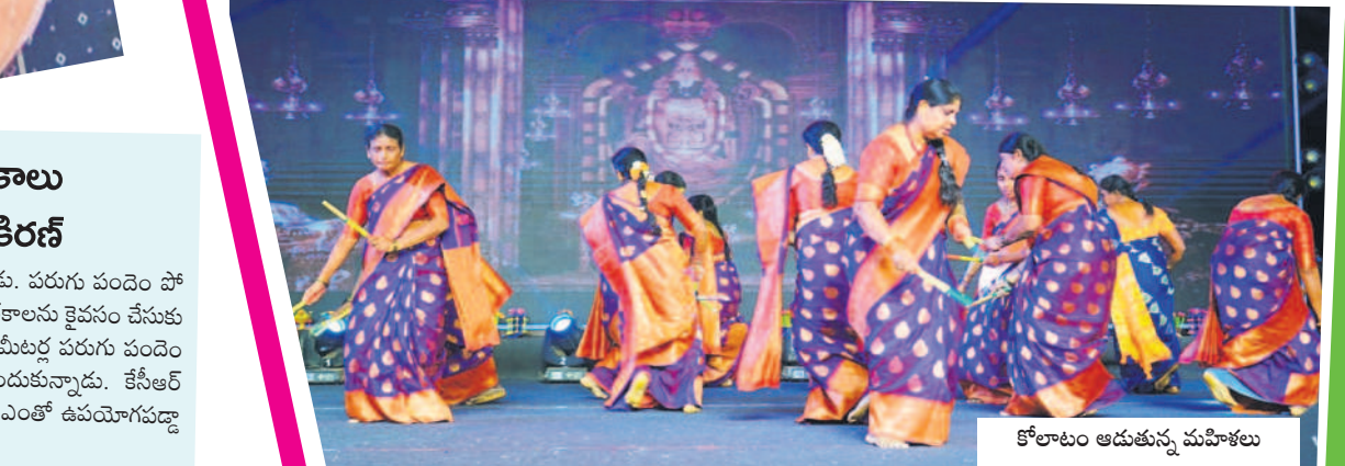
కోలాటం ఆడుతున్న మహిళలు