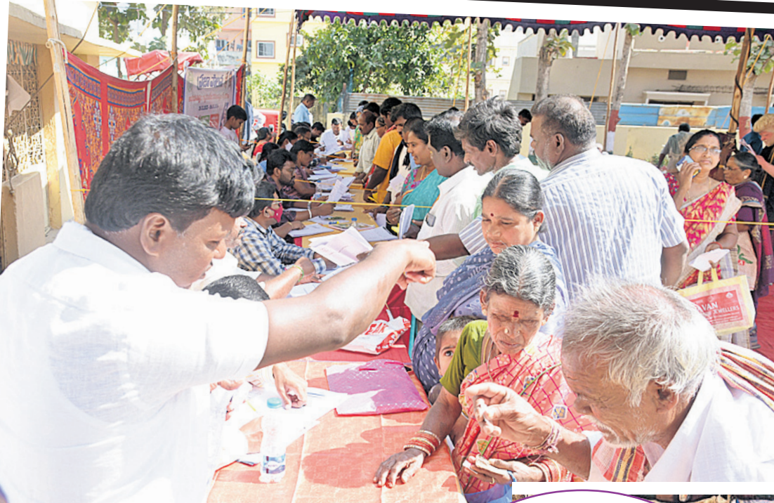
శంకరపల్లి : మోకలలో ప్రజల నుంచి దరఖాస్తులు తీసుకుంటున్న అధికారులు