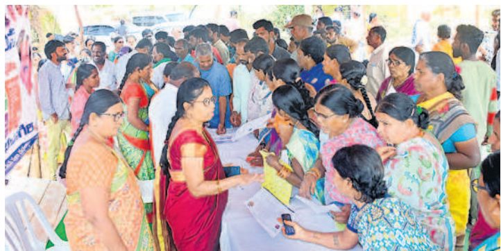
భువనగిరి మండలం రాయగిరిలో దరఖాస్తులు స్వీకరిస్తున్న అధికారులు

పలుచోట్ల దరఖాస్తుల కొరత ఇబ్బంది పడ్డ జనం