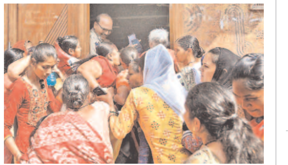
హైదరాబాద్ చుడిబజార్ ప్రజాపాలన దరఖాస్తుల కోసం ఎగబడుతున్న జనం >2

కొడంగల్ అభివృద్ధికి ప్రత్యేక అధికారి 8 మండలాలతో 'కాదా' ఏర్పాటు చైర్మన్గా వికారాబాద్ కలెక్టర్ స్పెషల్ ఆఫీసర్గా నాగర్ కర్నూల్ ఆర్డీతో ఉత్తర్వులు జారీ చేసిన రాష్ట్ర ప్రభుత్వం లోక్ సభ ఎన్నికల తర్వాత కొడంగల్ రెవెన్యూ డివిజన్ ప్రకటన? >10