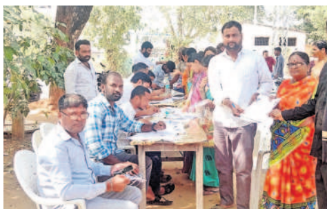
అబ్దుల్లాపూర్ మెట్ : ప్రజాపాలన కార్యక్రమంలో పాల్గొన్న ప్రజలు