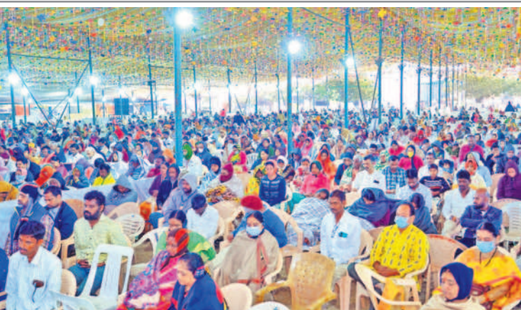
ధ్యానంలో పాల్గొన్న ధ్యానులు