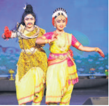
కళాకారుల నృత్య ప్రదర్శన