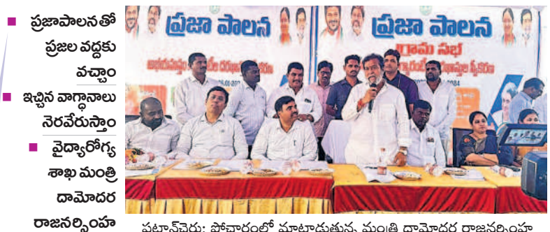
పటాన్చెరు: పోచారంలో మాట్లాడుతున్న మంత్రి దామోదర రాజనర్సింహ