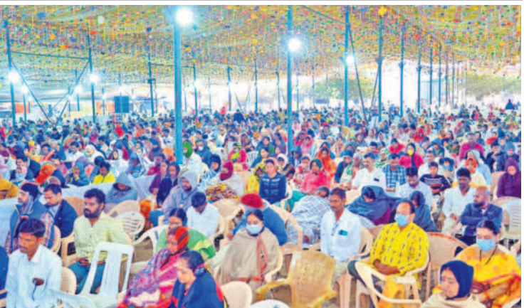
ధ్యానంలో పాల్గొన్న ధ్యానులు