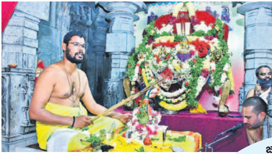
లక్ష్మీనరసింహుల తిరు కల్యాణోత్సవం జరిపిస్తున్న అర్చకులు

యాదగిరిగుట్ట, డిసెంబర్ 30 : యాదగిరిగుట్ట లక్ష్మీనరసింహుల నిత్య తిరు కల్యాణోత్సవం శనివారం శాస్త్రోక్తంగా జరిపించారు. ప్రధానాలయ వెలుపలి ప్రాకార మండపంలో సుదర్శన నారసింహ హోమం నిర్వహించిన అర్చకులు ఉత్సవ మూర్తులను ద్వివ మనోహరంగా అలంకరించి కల్యాణ మండపంలో స్వామి, అమ్మవార్లను వెంచే పు చేసి కల్యాణతరతు జరిపించారు. సుమారు గంటన్నరకు పైగా నిర్వహించిన తిరు కల్యాణోత్సవంలో భక్తులు పెద్ద సంఖ్యలో పాల్గొని వీక్షించారు. తెల్లవారుజామునే ఆలయాన్ని తెరిచిన అర్చకులు సుప్రభాతంలో స్వామిని మేల్కొల్పారు.