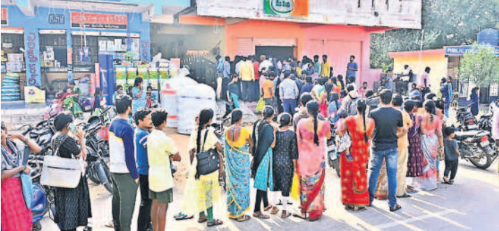
పాంచంపల్లి మీ సేవ సెంటర్ వద్ద భారులు తీరిన ప్రజలు