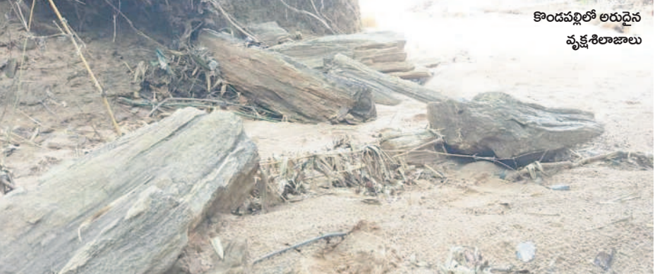
కొండపల్లిలో అరుదైన వృక్ష శిలాజాలు

కొన్నేళ్ల క్రితం మహారాష్ట్ర-తెలంగాణ సరిహద్దుల్లో ఉన్న గడ్డి రోలికి 15కిలో మీటర్ల దూరంలో వడగాంతో వృక్ష శిలాజాలను