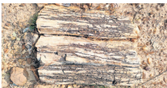
కొండపల్లిలో వృక్ష శిలాజాలు

30 ఎకరాల విస్తీర్ణంలో రకరకాల శిలాజాలు ● ఫాజిల్ పార్కుపక్కా చీన రక్షణ చర్యలు చేపట్టాలని కోరుతున్న స్థానికులు ● పర్యాటక అభివృద్ధికి కృషి చేస్తామంటున్న అధికారులు కాగజేనగర్ అటవీ డివిజన్లోని పెంచికల్ పేటలోని అరుదైన వృక్ష శిలాజాలకు కేరాఫ్ గా నిలుస్తున్నది. కొండపల్లి, బొంబాయిగూడ అటవీ ప్రాంతంలో 30 ఎకరాల విస్తీర్ణంలో ఉన్నట్లు యంత్రాంగం గుర్తించడం ప్రాధాన్యం సంతరించుకున్నది. వడగాంతోలాగే.. ఇక్కడ ఫాజిల్ పార్కు ఏర్పాటు చేసి.. వాటిని రక్షించాలని స్థానికులు కోరుతుండగా, సర్కారుకు నివేదికలందిస్తామని ఫార్మేషన్లు జమితున్నది.