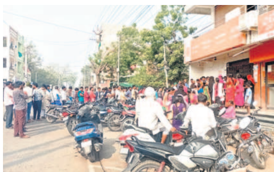
భీంపూర్ మండలంలోని ఆధార్ కేంద్రం వద్ద బారులు