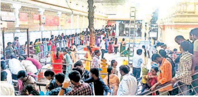
బాసర ఆలయంలో భక్తులు