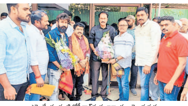
ఎమ్మెల్యే మాగంటి గోపీనాథ్ కు శుభాకాంక్షలు తెలుపుతున్న టెలివిజన్ టెక్నిషియన్ అండ్ డిజిటల్ మీడియా వర్కర్స్ ఫెడరేషన్ సభ్యులు