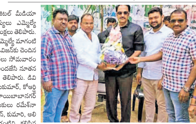
ఎమ్మెల్యే మాగంటికి శుభాకాంక్షలు తెలుపుతున్న బీఆర్ఎస్ నేతలు