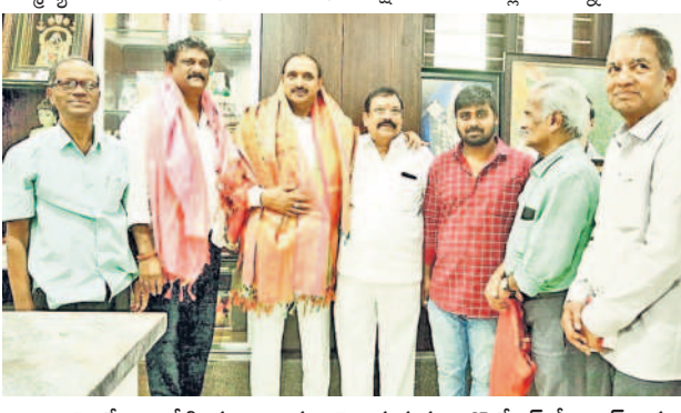
ఎమ్మెల్యే గాంధీకి శుభాకాంక్షలు తెలుపుతున్న కార్పొరేటర్ శ్రీనివాసరావు

ఎమ్మెల్యే మాగంటికి శుభాకాంక్షలు బంజారాహిల్స్, జనవరి 1: ఎమ్మెల్యే మాగంటి గోపీనాథ్ కార్యాలయంలో నూతన సంవత్సర వేడుకలు ఘనంగా నిర్వహించారు. పెద్ద సంఖ్యలో కార్యకర్తలు ఎమ్మెల్యే మాగంటి గోపీనాథ్ కు శుభాకాంక్షలు తెలిపారు.