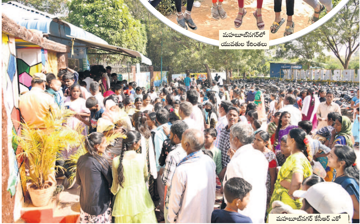
మహబూబ్ నగర్ కేసీఆర్ ఎకో అర్చన పార్కు ఎంట్రెన్స్ వద్ద టిక్కెట్ కోసం క్యూలో నిల్చున్న ప్రజలు