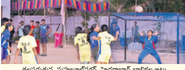
తలపడుతున్న మహబూబ్ నగర్, హైదరాబాద్ బాలికల జట్టు