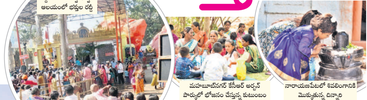
మల్లకల్ వేంకటేశ్వరస్వామి ఆలయంలో భక్తుల రద్దీ