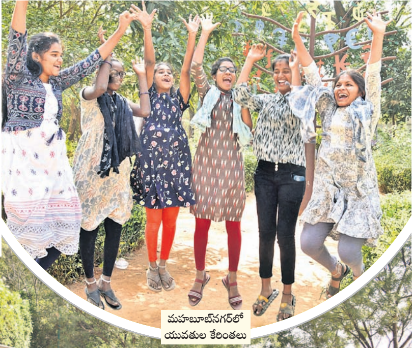
మహబూబ్ నగర్ లో యువకుల కేలంతలు