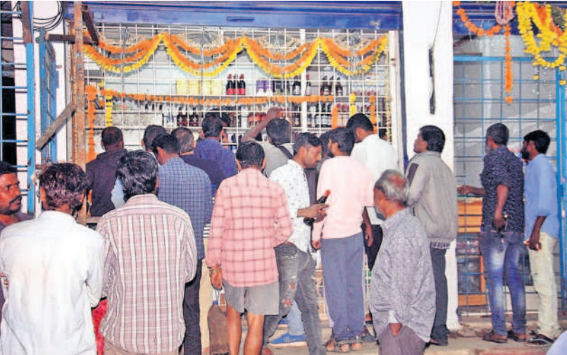
ఆదివారం రాత్రి సంగారెడ్డి పట్టణంలో మద్యం కొనుగోలు చేస్తున్న జనం