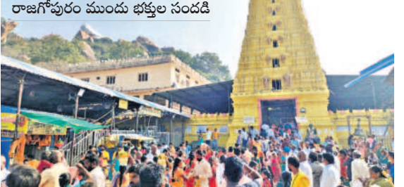
రాజగోపురం ముందు భక్తుల సందడి

చేర్లూ, జనవరి 1: ప్రముఖ పుణ్యక్షేత్రం కొమురవెల్లి మల్లికార్జున స్వామి క్షేత్రం సోమవారం భక్తజన సంద్రంగా మారిపోయింది. స్వామిని దర్శించుకునేందుకు రాష్ట్ర నలుమూలల నుంచి సుమారు 20వేల మందికి పైగా భక్తులు కొమురవెల్లికి తరలివచ్చినట్లు ఆలయ వర్గాలు తెలిపాయి. కొత్త సంవత్సరం మొదటి రోజు కావడంతో చేర్లూ, సిద్దిపేట, హుస్సాబాద్, గజ్వేల్, జనగామ, బచ్చిస్పేట, కరీంనగర్ తదితర ప్రాంతాల నుంచి భక్తులు భారీగా వచ్చారు. ఏటా మొక్కులు చెల్లించుకునే భక్తులు శనివారం ఉదయం నుంచే మల్లన్న క్షేత్రానికి చేరుకున్నారు. అనంతరం ఆలయ నిర్వహణలో ఉన్న గడులతోపాటు ప్రైవేటు గడులు అధిక తీసుకుని బస్ చేశారు. ఆదివారం కోనేరులో స్నానం చేసి, స్వామి దర్శ