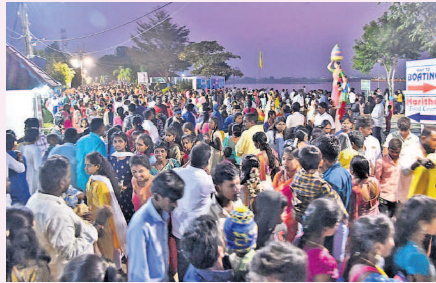
సిద్దిపేట కోమటి చెరువు కట్టపై పట్టణవాసుల సందడి