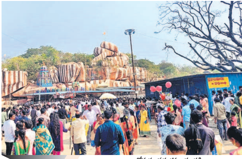
రాజగోపురం వద్ద భక్తుల సందడి

ఉమ్మడి మెదక్ జిల్లాలో డిసెంబర్లో రికార్డు స్థాయిలో మద్యం అమ్మకాలు జరిగాయి. 2023 డిసెంబర్ మొత్తంలో ఉమ్మడి మెదక్ జిల్లాలో రూ.376.65 కోట్ల మద్యం విక్రయించారు. 2022లో రూ.300.51 కోట్లు, 2023 డిసెంబర్లో సంగారెడ్డి జిల్లాలో 1,92,947 కేసుల లిక్కర్, 1,89,638 బీర్ కేసులు అమ్ముతున్నారన్నారు. వీటి విలువ రూ.180.27 కోట్లు, సిద్దిపేట జిల్లాలో 1,29,301 కేసుల లిక్కర్, 1,66,553 బీర్ కేసుల కొనుగోలు జరిగింది. వీటి విలువ రూ.131.13 కోట్లు. మెదక్ జిల్లాలో 69.6 కేసుల లిక్కర్, 77,786 కేసుల బీర్లను మద్యంస్థాయిలు కొనుగోలు చేశారు. దీంతో మెదక్ జిల్లాలో రూ.64.97 కోట్ల మద్యం అమ్మారు. మొత్తంగా డిసెంబర్లో ఉమ్మడి మెదక్ జిల్లాలో మద్యం స్థాయిలు రూ.376.65 కోట్ల ఆదాయాన్ని ఎవ్విజ్ శాఖకు సమకూర్చారు.