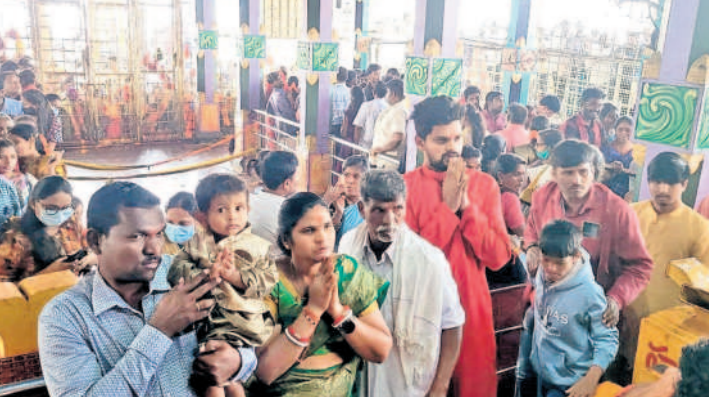
ఏడుపాయల వనదుర్గామాత అమ్మవారి దర్శనం కోసం క్యూలో వేచి ఉన్న భక్తులు