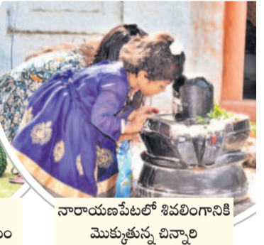
నారాయణపేటలో శివలింగానికి మొక్కుతున్న చిన్నారు