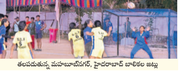
తలపడుతున్న మహాబూబ్ నగర్, హైదరాబాద్ బాలికల జట్టు