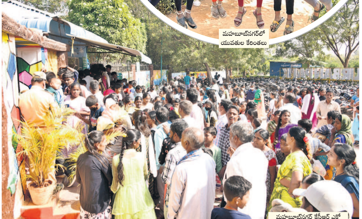
మహాబూబ్ నగర్ కేసీఆర్ అర్చన పార్కు ఎంట్రెన్స్ వద్ద టిక్కెట్ కోసం క్యూలో నిల్చున్న ప్రజలు

కాలచక్రం గిర్లున తిరిగింది. కష్టసుఖాలు, మంచి చెడులు, తీపి, చేదు అనుభవాలతో 2023 ఇట్టి గడిచిపోయింది. కొట్టి ఆశలతో 2024 వచ్చేసింది. ఆదివారం అర్ధరాత్రి నుంచే ఉమ్మడి మహాబూబ్ నగర్ జిల్లా వాసులు సంబురాలు పూరింబుండారు. యువత కేలంతలు కొడుతు కొత్త సంవత్సరానికి స్వాగతం పలికారు. చిన్నా, పెద్దా తోడూ లేకుండా వేడుకలను ఆనందిస్తూ పోలతో జరుపుకొన్నారు. న్యూ ఇయర్ కేకుల కొనుగోళ్లతో బేకరీలు, మధ్యం దుకాణాలు, తీరాక్క రంగుల కొనుగోళ్లతో మార్కెట్లన్నీ కకకలాదాయి. అంది మొబైల్ లో వాట్సాప్, ఫేస్ బుక్, మెస్సేంజర్, ఇన్ స్టాగ్రామలో 'న్యూ ఇయర్ శుభాకాంక్షలు' సందేశాలు వెల్లువెత్తాయి. ప్రతీ ఒక్కరూ బంధువులు, స్నేహితులు, సన్నిహితులకు విషెస్ తెలిపారు. డ్యాన్స్ లు చేస్తూ పోరెత్తించారు. సామూహికంగా కేక్ కట్ చేసి ఒకరికొకరు తిరిపించుకుంటూ సందడి చేశారు. మహిళలు ముగ్గులు వేసి తమ ఇంటి వాకిళ్లను అందంగా తీర్చిదిద్దారు. సోమవారం తెల్లవారుజామున నుంచే ఆలయాల భక్తులతో కిటకిటలాడాయి. స్వామి, అమ్మ వార్ల దర్శనాలకు భక్తులు పోటిత్తారు. మొత్తమ్మీ దరిగాంతో ఆశలతో సూతన సంవత్సరానికి ఘనస్వాగతం పలికారు.