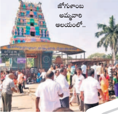
జోగుశాలం అమ్మవారి ఆలయంలో..