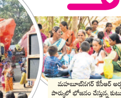
మహాబూబ్ నగర్ కేసీఆర్ అర్చన పార్కులో భోజనం చేస్తున్న కుటుంబం