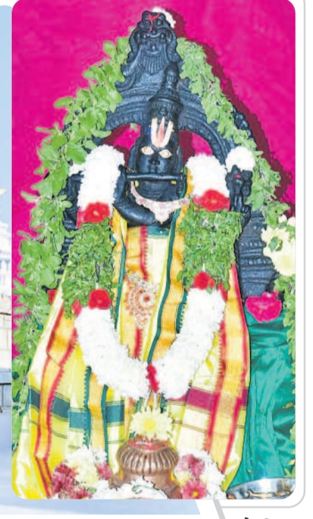
స్వామి వారి మూల విరాళం