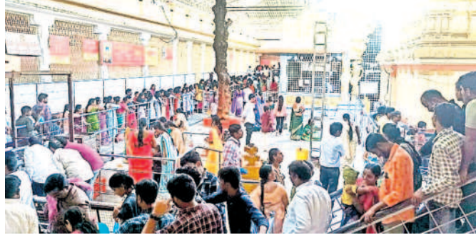
బాసర ఆలయంలో భక్తులు