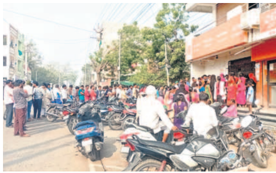
భీమాగండ్ల మండలంలోని ఆధార్ కేంద్రం వద్ద బారులు