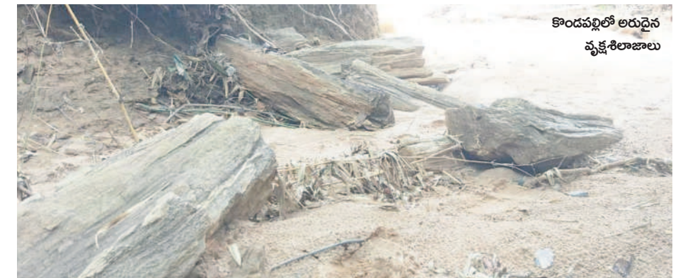
కొండపల్లిలో అరుదైన వృక్ష శిలాజాలు