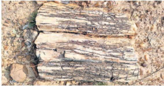
కొండపల్లిలో వృక్ష శిలాజాలు

పెంచికల్ పేట వృక్ష శిలాజాల కోట కొండపల్లి, బొంబాయిగూడ అడవుల్లో గుర్తింపు ● 30 ఎకరాల విస్తీర్ణంలో రకరకాల శిలాజాలు ● ఫాజిల్ పార్కుపర్వతం చేసే రక్షణ చర్యలు చేపట్టాలని కోరుతున్న స్థానికులు ● పర్యాటక అభివృద్ధి కృషి చేస్తామంటున్న అధికారులు కాగజేసగర్ అటవీ డివిజన్లోని పెంచికల్ పేటలోని అరుదైన వృక్ష శిలాజాలకు కేరాఫ్ గా నిలుస్తున్నది. కొండపల్లి, బొంబాయిగూడ అటవీ ప్రాంతంలో 30 ఎకరాల విస్తీర్ణంలో ఉన్నట్లు యంత్రాంగం గుర్తించడం ప్రాధాన్యం సంతరించుకున్నది. వడగాంతోలాగే.. ఇక్కడ ఫాజిల్ పార్కు పర్వతం చేసి.. వాటిని రక్షించాలని స్థానికులు కోరుతుండగా, సర్కారుకు నివేదికలందిస్తామని ఫార్మేషన్లు జమితున్నది.