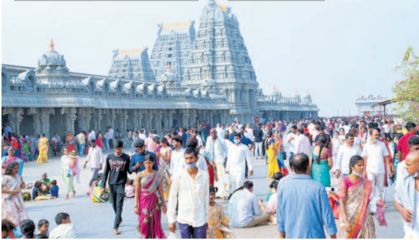
యాదగిరి గుట్ట ఆలయ ఆవరణలో భక్తజనం