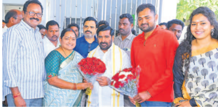
సూర్యాపేటలో ఎమ్మెల్యే జగదీశ్ రెడ్డికి పుష్పగుచ్ఛం ఇచ్చి నూతన సంవత్సర శుభాకాంక్షలు తెలుపుతున్న మున్సిపల్ చైర్మన్ అనప్పారావు

సూర్యాపేట టౌన్, జనవరి 1 : 2024 సంవత్సరంలో అందరి జీవితాల్లో కొత్త వెలుగులు నిండావి, అన్ని రంగాల ప్రజలంతా సరికొత్త ఆలోచనలతో, ఐక్యతతో ముందుకు సాగాలని సూర్యాపేట ఎమ్మెల్యే గుంటకండ్ల జగదీశ్ రెడ్డి ఇయర్ వేడుకలను మనంగా జరుపుకొన్నారు. ఈ సందర్భంగా ఎమ్మెల్యేకు నూతన సంవత్సర శుభాకాంక్షలు తెలిపేందుకు అధికారులు, ప్రజాప్రతినిధులు, బీఆర్ఎస్ నాయకులు, అభిమానులు పెద్ద సంఖ్యలో తరలివచ్చారు. క్యాంపు కార్యాలయం కిక్కిరిసింది. మొక్కలు, శాలువలు, పుష్పగుచ్ఛాలు అందజేసి నూతన సంవత్సర శుభాకాంక్షలు తెలిపారు. అనంతరం ఆయన మాట్లాడుతూ ప్రతి ఏడాది మాదిరిగానే 2023 వచ్చి వెళ్లిపోయిందని, కాబట్టి ఎవరి కోసం ఆగడం.. అందుకే సమయాన్ని వృథా చేయకుండా కష్టపడి ఉన్నత శిఖరాలను అధిరోహించాలని సూచించారు. 2024 ఏడాదంతా అందరికీ మంచి జరుగాలని, మరంత