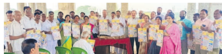
రెడ్డి సంక్షేమ సంఘం క్యాంపెయిన్ అధిష్టాధిపతి ఎమ్మెల్యే బీబీఆర్, ఎమ్మెల్సీ కోటిరెడ్డి

సూర్యాపేట టౌన్, జనవరి 1 : 2024 సంవత్సరంలో అందరి జీవితాల్లో కొత్త వెలుగులు నిండావి, అన్ని రంగాల ప్రజలంతా సరికొత్త ఆలోచనలతో, ఐక్యతతో ముందుకు సాగాలని సూర్యాపేట ఎమ్మెల్యే గుంటకండ్ల జగదీశ్ రెడ్డి ఇయర్ వేడుకలను మనంగా జరుపుకొన్నారు. ఈ సందర్భంగా ఎమ్మెల్యేకు నూతన సంవత్సర శుభాకాంక్షలు తెలిపేందుకు అధికారులు, ప్రజాప్రతినిధులు, బీఆర్ఎస్ నాయకులు, అభిమానులు పెద్ద సంఖ్యలో తరలివచ్చారు. క్యాంపు కార్యాలయం కిక్కిరిసింది. మొక్కలు, శాలువలు, పుష్పగుచ్ఛాలు అందజేసి నూతన సంవత్సర శుభాకాంక్షలు తెలిపారు. అనంతరం ఆయన మాట్లాడుతూ ప్రతి ఏడాది మాదిరిగానే 2023 వచ్చి వెళ్లిపోయిందని, కాబట్టి ఎవరి కోసం ఆగడం.. అందుకే సమయాన్ని వృథా చేయకుండా కష్టపడి ఉన్నత శిఖరాలను అధిరోహించాలని సూచించారు. 2024 ఏడాదంతా అందరికీ మంచి జరుగాలని, మరంత