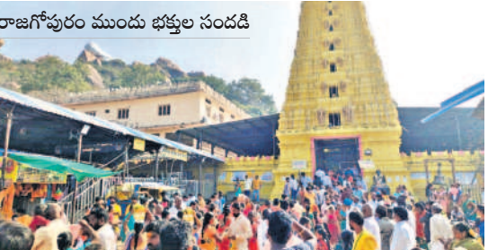
రాజగోపురం ముందు భక్తుల సందడి

చేర్లూ, జనవరి 1: ప్రముఖ పుణ్యక్షేత్రం కొమురవెల్లి మల్లికార్జున స్వామి క్షేత్రం సోమవారం భక్తజన సంద్రంగా మారిపోయింది. స్వామిని దర్శించుకునేందుకు రాష్ట్ర నలుమూలల నుంచి సుమారు 20వేల మందికి పైగా భక్తులు కొమురవెల్లికి తరలివచ్చినట్లు ఆలయ వర్గాలు తెలిపాయి. కొత్త సంవత్సరం మొదటి రోజు కావడంతో చేర్లూ, సిద్దిపేట, హుస్సేనూర్, గజ్వేల్, జనగామ, బచ్చిస్పేట, కరీంనగర్ తదితర ప్రాంతాల నుంచి భక్తులు భారీగా వచ్చారు. ఏటా మొక్కులు చెల్లించుకునే భక్తులు శనివారం ఉదయం నుంచే మల్లన్న క్షేత్రానికి చేరుకున్నారు. అనంతరం ఆలయ నిర్వహణలో ఉన్న గడులతోపాటు స్ట్రైమ్ గడులు అధిక తీసుకుని బస్ చేశారు. ఆదివారం కోనేరులో స్నానం చేసి, స్వామి దర్శ