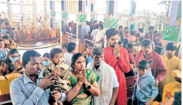
ఏడుపాయల వనదుర్గామాత అమ్మవారి దర్శనం కోసం క్యూలో వేచి ఉన్న భక్తులు