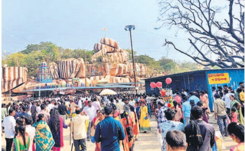
రాజగోపురం వద్ద భక్తుల సందడి