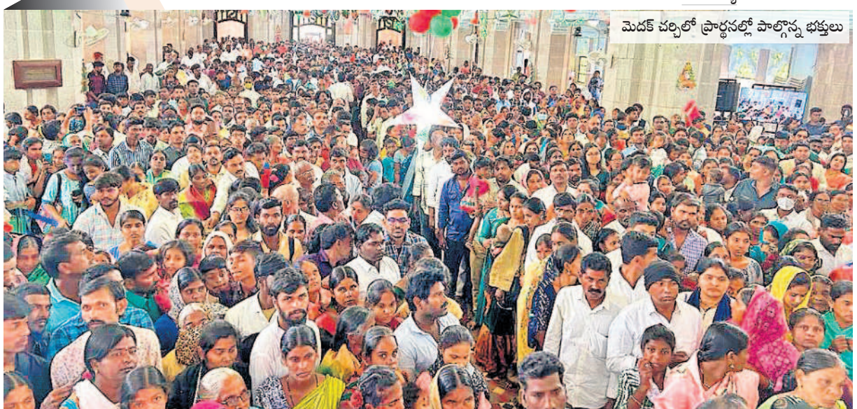
మెదక్ చర్చిలో ప్రార్థనలో పాల్గొన్న భక్తులు