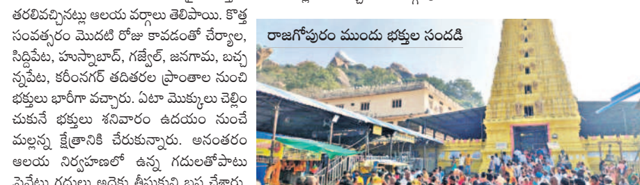
రాజగోపురం ముందు భక్తుల సందడి