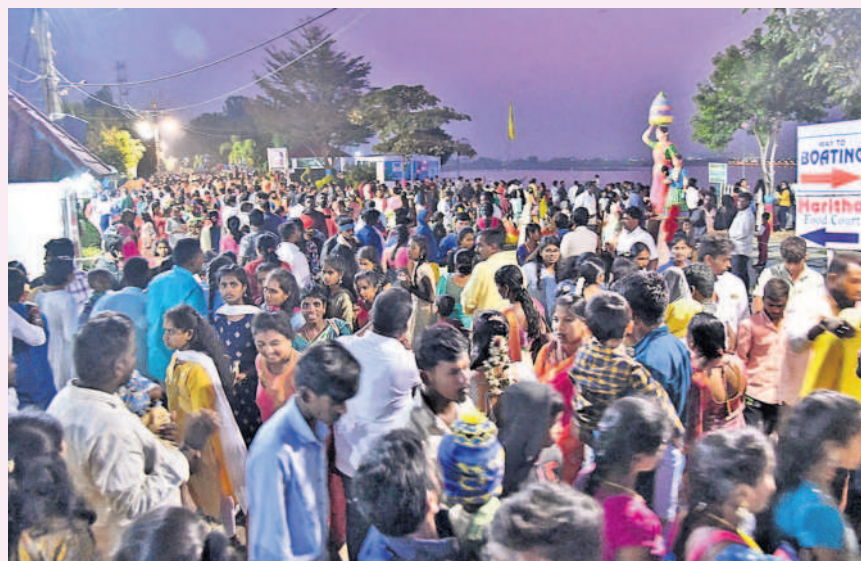
సిద్దిపేట కోమటి చెరువు కట్టపై పట్టణవాసుల సందడి