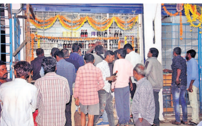
ఆదివారం రాత్రి సంగారెడ్డి పట్టణంలో మద్యం కొనుగోలు చేస్తున్న జనం

డిసెంబర్లో రూ.376 కోట్ల మద్యం అమ్మకాలు ఉమ్మడి మెదక్ జిల్లాలో డిసెంబర్లో రికార్డు స్థాయిలో మద్యం అమ్మకాలు జరిగాయి. 2023 డిసెంబర్ మొత్తంలో ఉమ్మడి మెదక్ జిల్లాలో రూ.376.65 కోట్ల మద్యం విక్రయించారు. 2022లో రూ.300.51 కోట్లు, 2023 డిసెంబర్లో సంగారెడ్డి జిల్లాలో 1,92,947 కేసుల లిక్కర్, 1,89,638 బీర్ కేసులు అమ్ముడుపోయాయి. వీటి విలువ రూ.180.27 కోట్లు, సిద్దిపేట జిల్లాలో 1,29,301 కేసుల లిక్కర్, 1,66,553 బీర్ కేసుల కొనుగోలు జరిగింది. వీటి విలువ రూ.131.13 కోట్లు. మెదక్ జిల్లాలో 69.6 కేసుల లిక్కర్, 77,786 కేసుల బీర్లను మద్యంస్థాయిలు కొనుగోలు చేశారు. దీంతో మెదక్ జిల్లాలో రూ.64.97 కోట్ల మద్యం అమ్మారు. మొత్తంగా డిసెంబర్లో ఉమ్మడి మెదక్ జిల్లాలో మద్యం స్థాయిలు రూ.376.65 కోట్ల మెదక్ జిల్లాలో రెండు రోజుల్లో 1,02,575 కేసుల