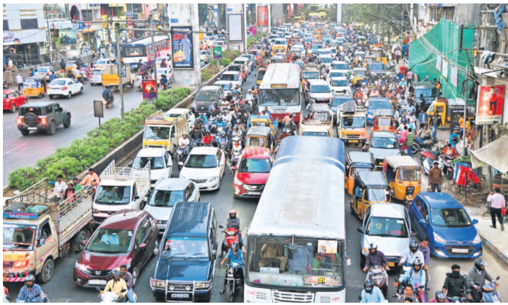
ట్రక్కులు, ట్యాంకర్ డ్రైవర్ల సమ్మెతో రవాణా స్తంభిల్లింది. పెట్రోల్ కోసం బంకులకు జనం పోటెత్తారు. కిలోమీటర్ల కొద్ది ట్రాఫిక్ జామలతో నగర లోడ్లపై వాహనదారులకు నరకం కనిపించింది. హైదరాబాద్ లోని జేగంపేటలో రోజంతా కనిపించిన దృశ్యమిది.