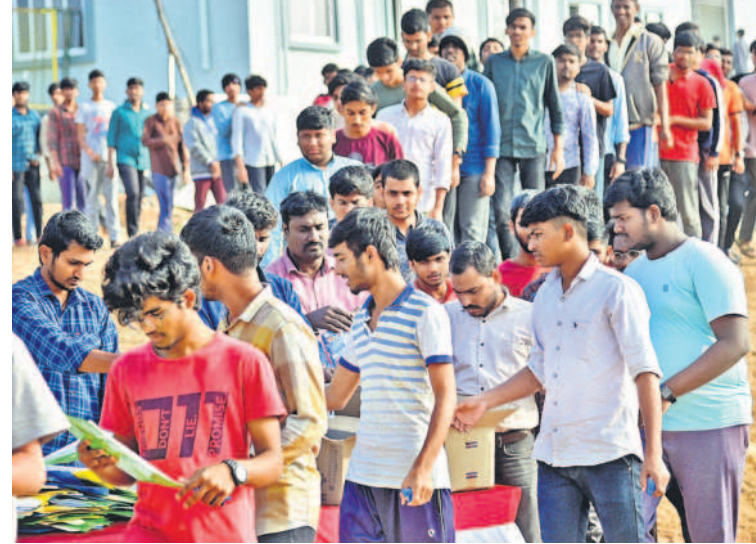
చరక భవన్లో సెమినార్కు హాజరవుతున్న విద్యార్థులు