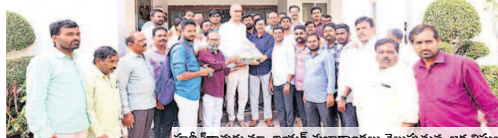
హరిశ్చంద్రావుకు న్యూ ఇయర్ శుభాకాంక్షలు తెలుపుతున్న జర్నలిస్టులు