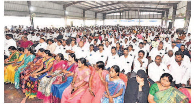
దుబ్బాకలో బీఆర్ఎస్ కృతజ్ఞత సభలో పాల్గొన్న నియోజకవర్గ కార్యకర్తలు