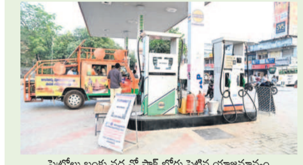
పెద్దగూడ బంకుల వద్ద నో స్టాప్ బోర్డు పెట్టిన యాజమాన్యం

మంచెర్యాల అర్బన్, జనవరి 2 : పెద్దగూడ, డిజిల్ లాగి ట్యాంకర్ల డ్రైవర్లు సమ్మెలోకి వెళ్లగా.. మంగళవారం వాహనదారులు బంకుల వద్ద బారులు తీరారు. ఉమ్మడి ఆదిలాబాద్ జిల్లాలో ఏ బంకు వద్ద చూసినా వాహనాల రద్దీ కనిపించింది. ట్రాక్టర్లు, లారీలు, స్కూలు బస్సులు, ద్వీచక్ర వాహనాలు పెద్ద సంఖ్యలో వేరుకోవడంతో ఆయాచోట్ల ట్రాఫిక్ జామ్ అయ్యింది. కొందరు ద్వీచక్ర వాహనదారులు బాటిల్లో పెద్దగా పోయి పంపించడం, మిగతా వారు గొడవకు దిగడంతో బాటిల్లో పెద్దగా పోయడం నిలిచిపోయింది. కొన్ని బంకుల్లో నో స్టాప్ బోర్డులు పెట్టారు. ఇక మిగతా బంకుల్లో ఇంధనం అయిపోతే పరిస్థితి ఏమిటని అందోళ్లన చెందుతుండగా, సాయంత్రం సమయం వరకు ట్యాంకర్ల డ్రైవర్లు ప్రకటించడంతో అంతా ఊపిరిపీల్చుకున్నారు. సీల్డ్ మేనేజర్ల స్వయంగా వచ్చి రాత్రి వరకు పూర్తిగా చేపట్టినా వాహనదారులు వివక్షపాటం గమనార్హం.