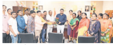
కలెక్టర్ సంతోష్ కు శుభాకాంక్షలు తెలుపుతున్న కలెక్టరేట్ సిబ్బంది

మంచెర్యాల అర్బన్, జనవరి 2 : కలెక్టరేట్లో కలెక్టర్ బదావత్ సంతోష్, అదనపు కలెక్టర్ సబావత్ మోతీలాల్, ఎమ్మెల్యే గృహంలో ప్రేమసాగర్ రావుకు ఆయా శాఖల అధికారులు, కలెక్టరేట్ సిబ్బంది, పసతి గృహ సంక్షేమ అధికారుల సంఘం నాయకులు నూతన సంవత్సర శుభాకాంక్షలు తెలిపారు.