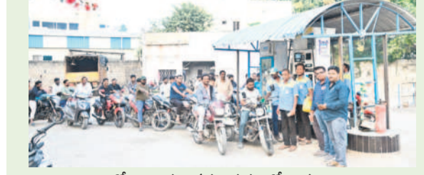
పెద్దగూడ బంకుల వద్ద పెద్ద క్యూలో వాహనాలు

మంచెర్యాల అర్బన్, జనవరి 2 : పెద్దగూడ, డిజిల్ లాగి ట్యాంకర్ల డ్రైవర్లు సమ్మెలోకి వెళ్లగా.. మంగళవారం వాహనదారులు బంకుల వద్ద బారులు తీరారు. ఉమ్మడి ఆదిలాబాద్ జిల్లాలో ఏ బంకు వద్ద చూసినా వాహనాల రద్దీ కనిపించింది. ట్రాక్టర్లు, లారీలు, స్కూలు బస్సులు, ద్వీచక్ర వాహనాలు పెద్ద సంఖ్యలో వేరుకోవడంతో ఆయాచోట్ల ట్రాఫిక్ జామ్ అయ్యింది. కొందరు ద్వీచక్ర వాహనదారులు బాటిల్లో పెద్దగా పోయి పంపించడం, మిగతా వారు గొడవకు దిగడంతో బాటిల్లో పెద్దగా పోయడం నిలిచిపోయింది. కొన్ని బంకుల్లో నో స్టాప్ బోర్డులు పెట్టారు. ఇక మిగతా బంకుల్లో ఇంధనం అయిపోతే పరిస్థితి ఏమిటని అందోళ్లన చెందుతుండగా, సాయంత్రం సమయం వరకు ట్యాంకర్ల డ్రైవర్లు ప్రకటించడంతో అంతా ఊపిరిపీల్చుకున్నారు. సీల్డ్ మేనేజర్ల స్వయంగా వచ్చి రాత్రి వరకు పూర్తిగా చేపట్టినా వాహనదారులు వివక్షపాటం గమనార్హం.