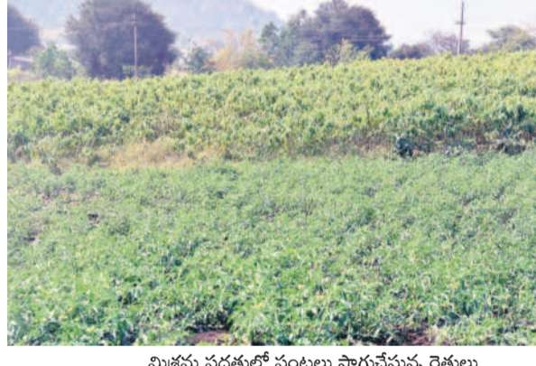
మిశ్రమ పద్ధతుల్లో పంటలు సాగుచేస్తున్న రైతులు

కుటుంబం ఆసిఫాబాద్, జనవరి 2 (నమస్తే తెలంగాణ) : జిల్లా రైతులు మిశ్రమ సాగుపై మక్కువ చూపుతున్నారు. తమకున్న చూపుతున్న యేటా ఒకే పద్ధతిలోనే వేసి కొద్దిపాటి భూమిలో రకరకలా పంటలు వేస్తూ లాభాలు బాట పడుతున్నారు. మారు తన్ను పరిస్థితులకు అనుగుణంగా.. మార్కెట్లో ఉన్న డిమాండ్ను బట్టి ప్రధానంగా నూనె గింజల సాగుపై ఆసక్తి చూపుతున్నారు. సంప్రదాయ పంటలైన పత్తి, వరి, కందికి బదులుగా వేరుశనగ, పొద్దు తిరుగుడు, నువ్వులు, కునుకుపంటల వాటిపై మొగ్గు చూపుతున్నారు. యేటా ఒకే పద్ధతిలోనే వేసి కొద్దిపాటి భూమిలో రకరకలా పంటలు వేస్తూ లాభాలు బాట పడుతున్నారు.