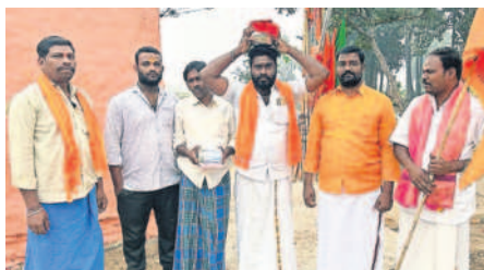
నారాయణపురం: అక్షింతలు పంపిణీ చేయడానికి తీసుకొస్తున్న సభ్యులు