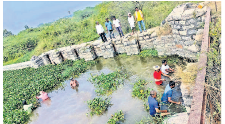
జాలకత్త వద్ద శ్రమదానం చేస్తున్న ఆయకట్టు రైతులు