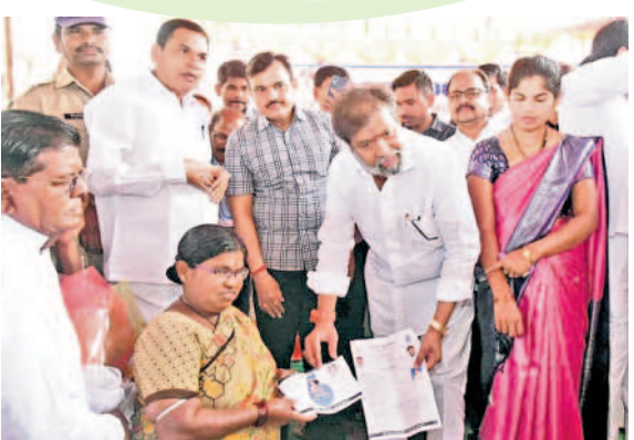
రాయికోడ్ లో మహిళ నుంచి ప్రజాపాలన దరఖాస్తు స్వీకరిస్తున్న మంత్రి దామోదర రాజనర్సింహ