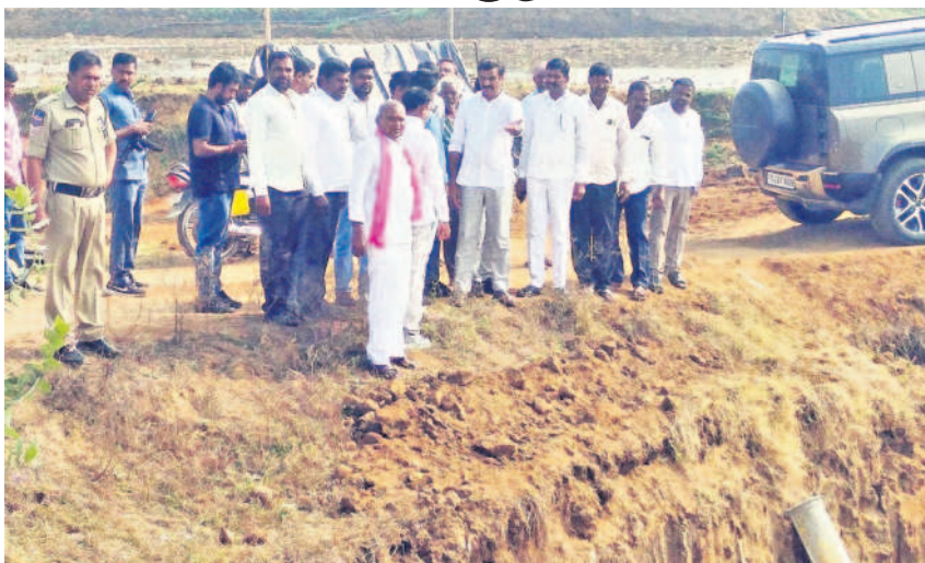
అచ్చుమాయిపల్లి శివారులో మల్లన్న సాగర్ సబ్ కాల్వల నిర్మాణ పనులను పరిశీలిస్తున్న ఎమ్మెల్యే ప్రభాకర్ రెడ్డి

రైతుల సంక్షేమమే లక్ష్యంగా కేసీఆర్ సర్కారు ఎంతగానో కృషిచేసి మల్లన్న సాగర్ ప్రాజెక్టును నిర్మించిందిని దుబ్బాక ఎమ్మెల్యే కొత్త ప్రభాకర్ రెడ్డి తెలిపారు. మల్లన్న సాగర్ కాల్వల నిర్మాణంలో అధికారులు, కాంట్రాక్టర్లు నిర్లక్ష్యంగా వ్యవహరించడం సరికాదన్నారు. దుబ్బాక మండలం పోతారం, గంభీరపూర్, అప్పమాయి పల్లి గ్రామాల మీదుగా నిర్మిస్తున్న మల్లన్న సాగర్ ఎల్ 4 కాల్వల పనులను బుధవారం ఇరిగేషన్ అధికారులతో కలిసి ఆయన పరిశీలించారు. మల్లన్న సాగర్ కాల్వల నిర్మాణంలో జూప్యంపై ఎమ్మెల్యే స్పందించారు. మల్లన్న సాగర్ కాల్వల పనులు పూర్తిచేసి ఆకుపచ్చ దుబ్బాకగా తీర్చిదిద్దు తానని తెలిపారు. కేసీఆర్ బడి భవనంలో డిగ్రీ కళాశాల ఏర్పాటుకు చర్యలు చేపడుతామని, ఈ బడిని సర్వీనియోగం చేసుకోవాలని కోరారు. - దుబ్బాక, జనవరి 3