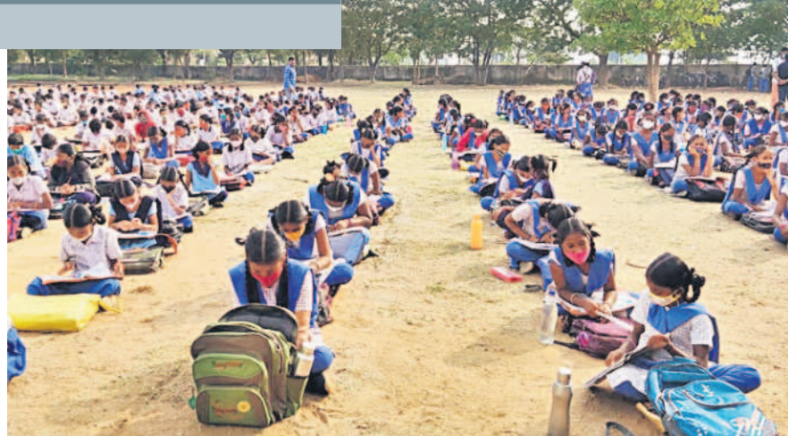
మెదక్ మున్సిపాలిటీ: ప్రత్యేక తరగతుల్లో చదువుకుంటున్న విద్యార్థులు