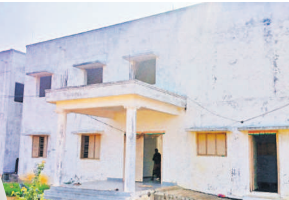
మద్దూరు మోడల్ స్కూల్ గర్ల్స్ స్కూల్లో భవనం

మద్దూరు (హాళిమిట్ల), జనవరి 3: పేద విద్యార్థులకు పాప్టికాహారాన్ని అందించాలనే సదుద్దేశంతో ప్రభుత్వం సంక్షేమ వసతిగృహాల్లో కోడిగుడ్డు, చికెన్, మటన్ ను అందిస్తున్నది. అధికారులు, కాంట్రాక్టర్ల చర్యలతో ప్రభుత్వ లక్ష్యం సీరుగారిపోతున్నది. సిద్దిపేట జిల్లా మద్దూరు మోడల్ స్కూల్ కు చెందిన బాలికల హాస్టల్ లో 49 మంది విద్యార్థులు అందని పాప్టికాహారం తీసుకోలేకపోతున్నారు. ప్రభుత్వం ప్రకటించిన మెనూ ప్రకారం సోం, మంగళ, గురు, శుక్రవారాల్లో కోడిగుడ్డు అందించాలి. 1, 3, 5వ అదివారాల్లో చికెన్, 2, 4 అదివారాల్లో మటన్ అందించాలి. ఈ హాస్టల్ లో నెల రోజులుగా విద్యార్థులకు కోడిగుడ్డు అందడం లేదు. చికెన్, మటన్ కూడా అందించడం లేదు.