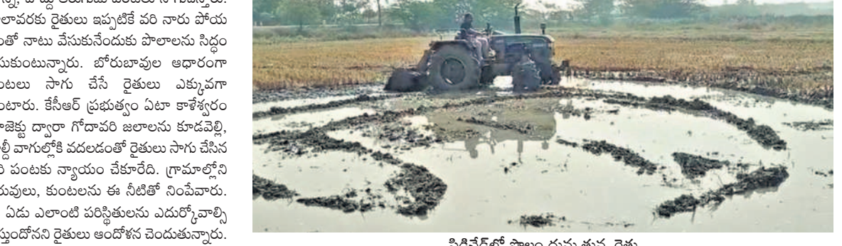
విడిచేదలో పాలం దున్నుతున్న రైతు

పెరుగుతున్న ఖర్చులు ఏడాది వ్యవధిలోనే సాగు ఖర్చులు పెరిగాయి. గతేడాదికి ఇప్పటికీ మాస్తే సాగులో ఖర్చు పదిశాతం పెరిగింది. గతంలో ఎకరం పాలం దున్నేందుకు ట్రాక్టర్ కు రూ.3 వేల నుంచి రూ.3500 వరకు తీసుకునేవారు. వరి నాటేందుకు కూలీ ఒక్కరికి రూ.500 వరకు చెల్లి