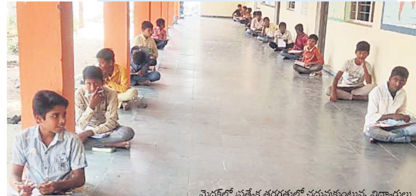
మెదక్ లో ప్రత్యేక తరగతుల్లో చదువుకుంటున్న విద్యార్థులు

వెనుకబడిన విద్యార్థులపై ప్రత్యేక దృష్టి దివి 9,500 మంది విద్యార్థులు పదో తరగతి పరీక్షలు రాయనున్నారు.