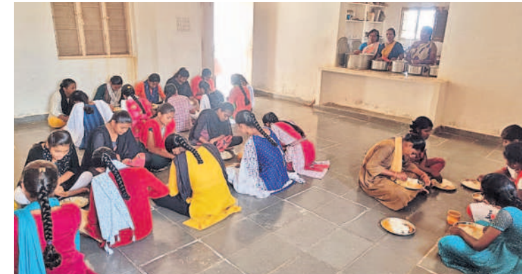
హాస్టల్ లో భోజనం చేస్తున్న విద్యార్థులు

జిల్లాలోని అన్ని హాస్టళ్లకు కోడిగుడ్డు సరఫరా చేసే హక్కు లను డిక్లయరు చేయాలని కాంట్రాక్టర్ జటి వల కోడిగుడ్డు ధరలు పెరుగుతుండడంతో తనకు గిట్టుబాటు కాదనే ఉద్దేశంతో హాస్టల్ కు కోడిగుడ్డు సరఫరాను నిలిపివే