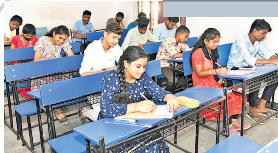
సిద్దిపేట అర్బన్: పరీక్ష రాస్తున్న విద్యార్థులు (ఫైల్)