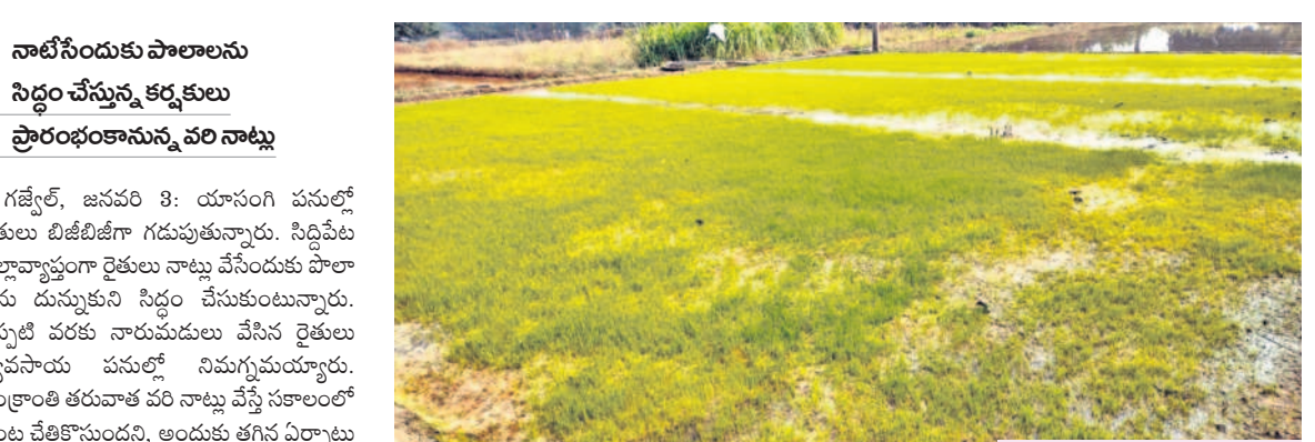
ప్రజ్ఞాపూర్వక సమీపంలో పరిసారు