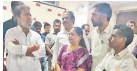
అందోల్: మంత్రితో మాట్లాడుతున్న ప్రిన్సిపాల్, సిబ్బంది