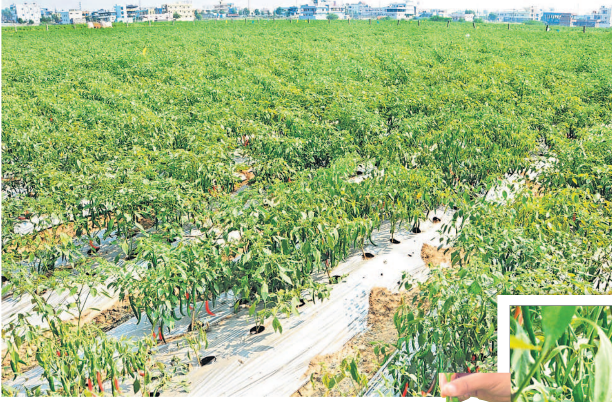
భూపాలపల్లి మండలంలోని పుల్లూరుపయ్యపల్లిలో మల్లింగ్ విధానంలో సాగుతున్న మిర్చి పంట