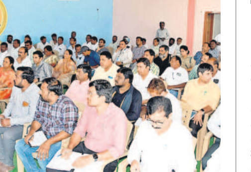
సమావేశంలో పాల్గొన్న ఆయా శాఖల అధికారులు