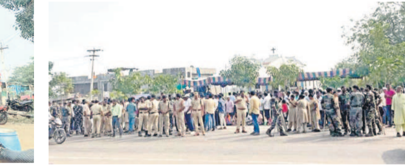
దిలావర్పూర్ జాతీయ రహదారిపైకి రాకుండా బారీ బందీబంధులు నిర్వహిస్తున్న పోలీస్ బలగాలు