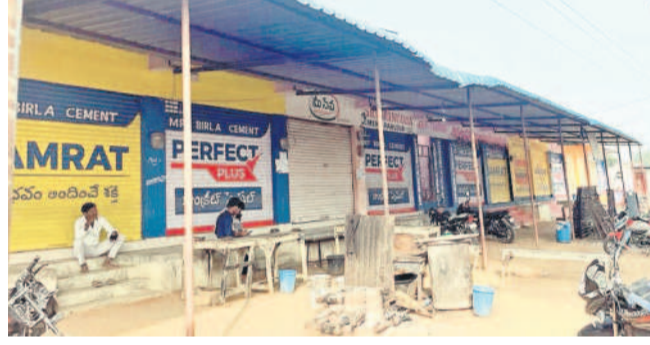
దిలావర్పూర్ మండల కేంద్రంలో మూసి ఉన్న దుకాణాలు

దిలావర్పూర్, జనవరి 4 : నిర్మల్ జిల్లా దిలావర్పూర్-గుండంపల్లి గ్రామాల మధ్య నిర్మిస్తున్న ఇథనాల్ పరిశ్రమ నిర్మాణ స్థలాన్ని బుద్ధవారం ముట్టడించి.. గోడలు కూల్చివేసి, ఫర్నిచర్ ధ్వంసం చేసి, వాహనాలకు నిప్పు పెట్టిన పలువురు