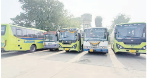
నిర్మల్ డిపోకు చేరని నూతన బస్సులు

నిర్మల్ ఆర్డర్, జనవరి 4 : ఆదిలాబాద్ రీజియన్ కు ఆరు నూతన బస్సులు మంజూరయ్యాయి. ఇందులో ఎక్స్ ప్రెస్, రాజధాని బస్సులు ఉన్నాయి. 15 లక్షల కిలో మీటర్లు పూర్తి చేసినందున రిఫైన్ మెంట్ లో భాగంగా ఇచ్చినట్లు ఆదిలాబాద్ రీజియన్ కు ఆరు నూతన బస్సులు, ఒక ఎక్స్ ప్రెస్, ఒక ఎక్స్ ప్రెస్.. మంజూరయ్యాయి. ఆదిలాబాద్ డిపోకు ఒక రాజధాని, ఒక ఎక్స్ ప్రెస్.. మంజూరయ్యాయి. ఆదిలాబాద్ డిపోకు ఒక రాజధాని, ఒక ఎక్స్ ప్రెస్.. మంజూరయ్యాయి.