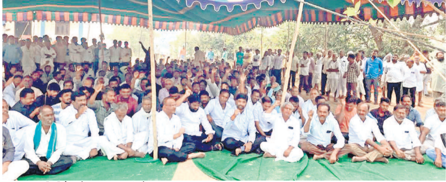
దిలావర్పూర్ లోని జాతీయ రహదారి పక్కన డిజిల్ ట్యాంకులు, నాయకులు