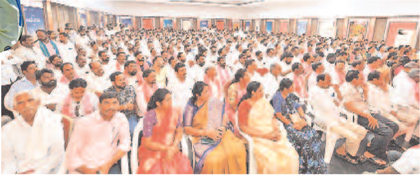
కార్యక్రమం, నాయకుల రాకతో తెలంగాణభవన్ మరోసారి సందడిగా మారింది. గురువారం జరిగిన కరీంనగర్ లోక్సభ నియోజకవర్గ సమావేశంలో పాల్గొన్న నేతలు

ఆరు వికెట్లతో విజృంభణ దక్షిణాఫ్రికాపై భారత్ విజయం కేప్టెన్ రోహిత్ శర్మ చలత్రాక విజయంతో కడం తొక్కింది. తొలి ఇన్నింగ్స్లో హైదరాబాద్ స్టేడియంలో సిరాజ్ అదరగొడితే.. మలి ఇన్నింగ్స్లో బుమ్రా సఫారీలను చెడుగుడు అడుకున్నాడు. బుమ్రా ఆరు వికెట్ల విజృంభణతో దక్షిణాఫ్రికా రెండో ఇన్నింగ్స్లో 176 పరుగుల వద్దే కుప్పకూలింది. ఓపెనర్ మార్కెస్ (106) సంపాదించినా ఫలితం తేలేకపోయింది. 79 పరుగుల స్వల్ప లక్ష్యవేధనలో మూడు వికెట్లు చేజారుతున్న భారత్.. కేప్టెన్ రోహిత్ శర్మ విజయాన్ని సగర్వంగా ముద్దాడింది. ఫలితంగా భారత్, దక్షిణాఫ్రికా మధ్య మ్యాచ్ అతి తక్కువ (642) బంతుల్లో ముగిసిన టెస్టుగా అరుదైన రికార్డు సాధించింది. రెండు మ్యాచ్ల ప్రీమ్ సెరీస్ కార్డు 1-1తో సమంగా ముగిసింది. > 14