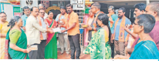
రాముడి అక్షింతలను ఇంటింటికీ వితరణ చేస్తున్న భక్తులు

కాప్రా, జనవరి 4: అయోధ్య శ్రీరామ జన్మభూమి తీర్థ క్షేత్ర ట్రస్ట్ కుషాయిగూడ ఆధ్వర్యంలో అయోధ్యరాముడి అక్షింతలను, కుషాయి గూడ సాయిమిత్ర టవర్స్ లో శ్రీరామస్వర్ణ అక్షింతలను గురువారం వినాయక ఆలయంలో భక్తులు పూజలు నిర్వహించారు. అనంతరం భక్తులు అక్షింతలతో ఊరేగింపు నిర్వహించి ఇంటింటికీ వితరణ చేశారు.