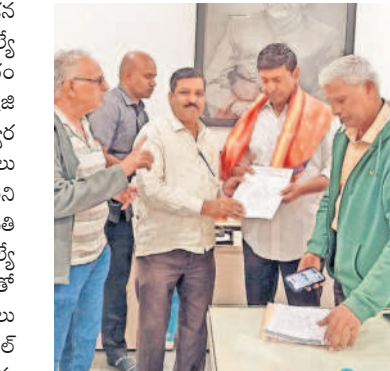
ఎమ్మెల్యే మర్రి రాజశేఖర్ రెడ్డికి వినతి పత్రం అందజేస్తున్న నాయకులు

మల్కాజిగిరి, జనవరి 4: యుద్ధప్రాతిపదికన రోడ్లకు మరమ్మతులు చేపడతామని ఎమ్మెల్యే మర్రి రాజశేఖర్ రెడ్డి అన్నారు. గురువారం బోయినపల్లి క్యాంప్ కార్యాలయంలో మల్కాజిగిరి సర్కిల్ ఓల్డ్ సఫీల్ గూడ సుధానగర్, ద్వారకామయికాలనీ నుంచి రాక్ చర్చి రోడ్డు గుంతలు పడ్డాయని, వెంటనే మరమ్మతులు చేయాలని కోరుతూ ఎమ్మెల్యేకు స్థానిక నాయకులు వినతి పత్రం అందజేశారు. ఈ సందర్భంగా ఎమ్మెల్యే మర్రి మాట్లాడుతూ గుంతలు పడిన రోడ్లతో వాహనదారులతో పాటు ప్రజలు ఇబ్బందులు పడుతున్నట్లు గుర్తించామన్నారు. ఓల్డ్ సఫీల్ గూడ బస్ స్టాపు, సుధానగర్, ద్వారకామయికాలనీ రాక్ చర్చి రోడ్లలో గతంలో డ్రైనేజీ వేయడంతో రోడ్డు గుంతలు పడ్డాయని, వెంటనే రోడ్లకు మరమ్మతులు చేపడతామన్నారు. మల్కాజిగిరి సర్కిల్ పరిధిలోని అన్ని మెయిన్ రోడ్లతో పాటు అంతర్గత రోడ్లను సర్వే చేయస్తామన్నారు. కొత్తగా సీసీ రోడ్లు వేస్తామని అన్నారు.