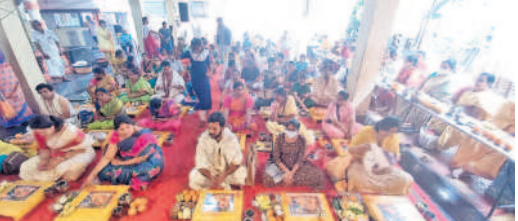
విజయవినాయక ఆలయంలో వైభవంగా అనఘాష్టమి పూజలు