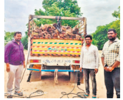
జోగుశాంబ గద్వాల జిల్లా నుంచి అశ్వాసాపుపేటకు ఆయిల్ పాం గిలలను తరలిస్తున్న రైతులు

రైతులు ఆయిల్ పాం సాగులో లాభాలు బాగా ఆర్జించొచ్చని ఉద్ఘాటన వణ అధికారులు చెబుతున్నారు. ఆయిల్ పాం సాగులో మూడేండ్ల వరకు అంతర్ పంటలు సాగు చేసుకోవడానికి అవకాశం ఉండడంతో రైతులు ఈ పంటను సాగు చేయడానికి ఆసక్తి చూపుతున్నారు. ఈ మొక్క నాటిన తర్వాత నాలుగో ఏడాది నుంచి కాపు మొదలై సుమారు 30 ఏండ్లపాటు నిరంతరం ఆదాయం పొందవచ్చు. మొదటి మూడేండ్ల పాటు అంతర పంటగా పత్తి, మిరప, వేరుశనగ, ఆరటి, బొప్పాయి, కూరగాయలు వంటి పంటలు సాగు చేసుకోవచ్చు. ఈ వెట్టు 15 మీటర్ల వరకు ఎత్తు పెరిగే అవకాశం ఉంది. ఈ పంటలకు తెగన్న, బీడీవీడల పురుగుల బెడడ తక్కువగా ఉంటుంది. అంతర పంటలు సాగు చేసుకునే రైతులకు రూ.2100 ప్రభుత్వం ప్రోత్సాహం అందిస్తుంది. ప్రకృతి వైపరీత్యాలను తట్టుకోవడంలోపాటు అదవి పంటలు బెడడ ఉండదు. మూడేండ్ల తర్వాత ఎకరాకు 3 నుంచి నాలుగు టన్నుల దిగుబడి వస్తుంది. ఏడాదికి ఏడాది దిగుబడి పెరుగుతూ ఏడు సంవత్సరాల తర్వాత ఎకరాకు 10 టన్నుల వరకు దిగుబడి వచ్చే అవకాశం ఉంది. ప్రస్తుతం ఇక్కడ రైతులు పండించిన పంటను అశ్వాసాపుపేట మార్కెట్ తరలిస్తున్నారు.