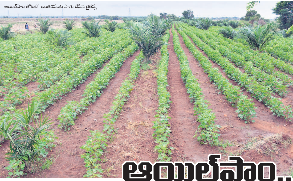
ఆయిల్ పాం తోటలో అంతరంపాటు సాగు చేసిన రైతులు