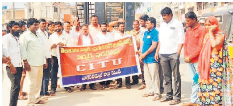
నాగర్ కర్నూల్ అంబేద్కర్ చౌరస్తాలో ధర్మా చేస్తున్న ఆటో యూనియన్ నాయకులు