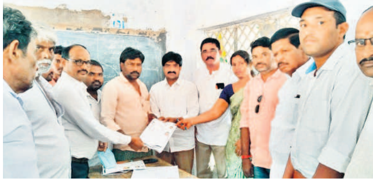
ప్రజాపాలన దరఖాస్తులను స్వీకరిస్తున్న ఎమ్మెల్యే విజయమడు