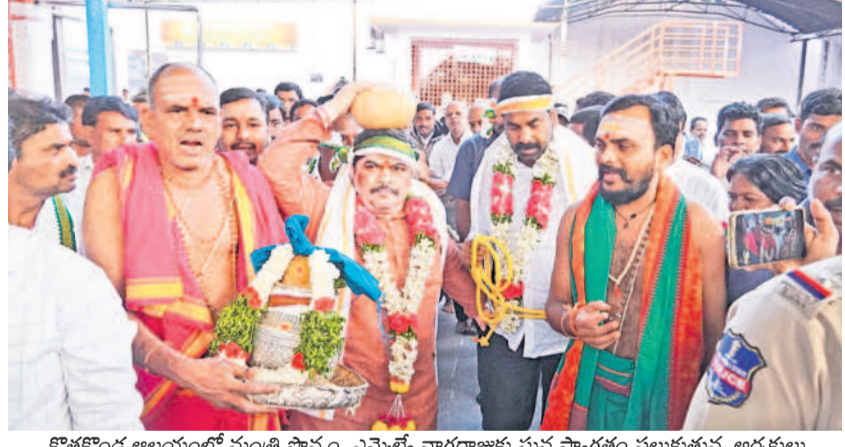
కొత్తకొండ ఆలయంలో మంత్రి పాస్వం, ఎమ్మెల్యే నాగరాజుకు ఘన స్వాగతం పలుకుతున్న అధ్యక్షులు

సస్పెండ్ బాధితుల జాబితాను ఆయా యజమానులకు చూపించి ఎందుకు డబ్బులు చెల్లించలేదని అడగడం వల్లనే చిట్టి డబ్బులు చెల్లించలేదని తెలిపారు. 30లోపు సీపీలు నిలిపివేసిన, పచ్చి నెల 15లోపు అందరికీ డబ్బులు చెల్లించాలని ఆదేశించారు. ప్రతి 15 రోజులకు ఒకసారి డబ్బులు చెల్లింపు ప్రత్యేకంగా సమీక్ష చేస్తామని, మళ్లీ ఇదే రివీజ్ చేస్తామని చెప్పారు. చిట్టి డబ్బులు చెల్లించలేదని తెలిపినవారిపై చర్యలు తీసుకుంటామని హెచ్చరించారు. సమావేశంలో జైలు డివీజన్ ముఖ్య అధికారి అసీసీ రిజిస్ట్రార్ వెణుమాడవ పాల్గొన్నారు.