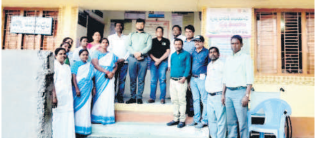
దవాఖానలో జాతీయ క్యాంటీన్ కంట్రోల్ బృంద సభ్యులు