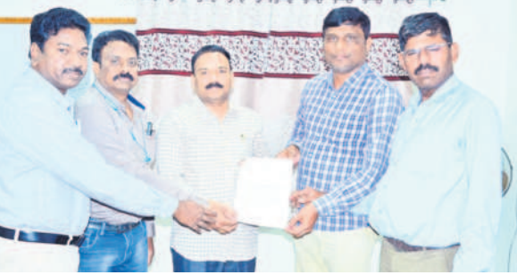
వినతి పత్రం అందజేస్తున్న అధికారుల సంఘం నాయకులు

గోదావరిభిని, జనవరి 4: సింగరేణి నూతన సీఎండిగా బాధ్యతలు చేపట్టిన బలరాంను అధికారుల సంఘం నాయకులు గురువారం కలిసి పలు సమస్యలు విన్నవించారు. ల్యాండ్ వార్ కౌన్సిలుకు రూ.1.20 లక్షలు చెల్లించాలని, గతంలో యాజమాన్యం ఇచ్చిన హామీలో భాగంగా అధికారుల పిల్లలకు ఐఐటి, ఐఐఎం పీఐఐ రీయంబర్స్ మెంట్, ఉద్యోగులకు ఉచిత విద్యుత్, డిమాండ్ అధికారులకు 4 శాతం పెన్షన్ అదనం చెల్లించాలని, రిటైర్ అధికారులకు లాభాల వాటా చెల్లించాలని కోరారు. కార్యక్రమంలో సీఎంపీఎంపి అధ్యక్షుడే పాటు నివేదించారు.