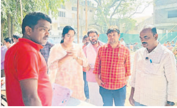
పెద్దపల్లి : దరఖాస్తుల వివరాలు తెలుసుకుంటున్న మున్సిపల్ చైర్మన్