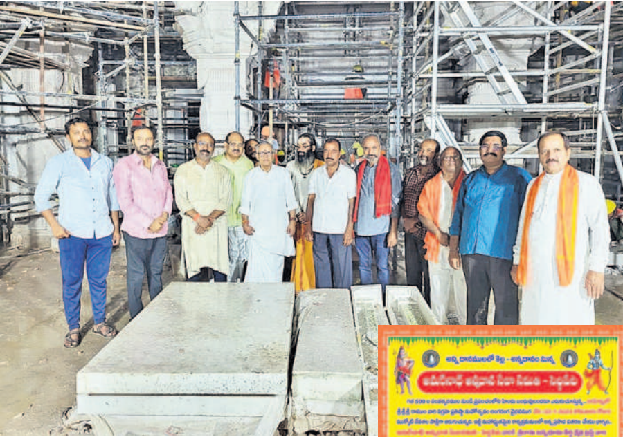
అయోధ్యలో రామమందిర నిర్మాణ స్థలంలో అమర్నాథ్ అన్నదాన సేవా సమితి సభ్యులు

నిర్మాత: నల్లవారు ప్రాజెక్టులో గంగమ్మకు పూజలు చేసే తెప్ప వదులుతున్న ఎమ్మెల్యే రేతుల