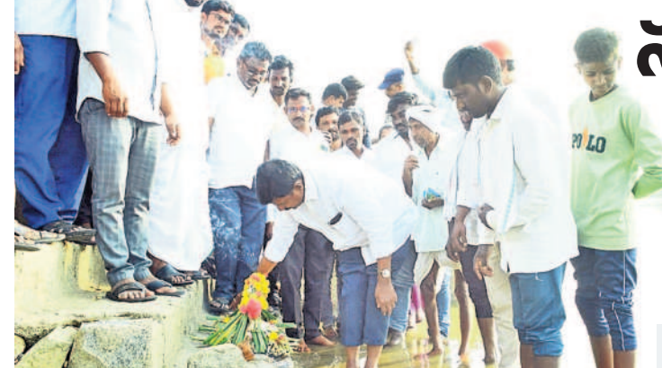
నిర్మాత: నల్లవారు ప్రాజెక్టులో గంగమ్మకు పూజలు చేసే తెప్ప వదులుతున్న ఎమ్మెల్యే రేతుల

జయప్రకాశ్ నారాయణ గజేల్, జనవరి 4 : దేశంలోని అన్ని రాష్ట్రాల్లో అధికారాన్ని నిర్ణయించేది ప్రజలేనని, ఎవరూ అధికారంలో ఉండాలో ప్రజలు తమ నిర్ణయాధికారాన్ని ఓటు రూపంలో వ్యక్త పరుస్తారని లోక్ సత్తా వ్యవస్థాపకుడు జయప్రకాశ్ నారాయణ అన్నారు. గురువారం గజేల్ మండలం ప్రజాస్ఫూర్తిలోని ఎన్.ఎల్.ఎన్ కన్వెన్షన్ హాల్లో మోహనరాం గారు సహా ప్రారంభించిన ముఖ్యఅతిథిగా విచ్చేసిన సందర్భంగా ఆయన మాట్లాడారు. తెలంగాణలో జరిగిన అనేక ఎన్నికల్లో ఆయా పార్టీల ఎన్నికల ఖర్చు రూ.8వేల కోట్ల నుంచి రూ.10వేల కోట్ల