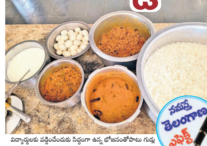
విద్యార్థులకు వడ్డించేందుకు సిద్ధంగా ఉన్న భోజనంతోపాటు గుడ్డు

మద్యూరు (మాశిపిట్ట), జనవరి 4 : మద్యూరు లోని మోడల్ స్కూల్ బాలికల హాస్టల్ లో నెలరోజులూ విద్యార్థులకు కోడిగుడ్డు అందజేపడడంతో 'నమస్తే తెలంగాణ' దినపత్రికలో 'గుడ్డు గుంటకాయ స్వాగత' అనే శీర్షికతో బుధవారం కథనాన్ని ప్రచురించడంతో గురువారం కాంట్రాక్టర్ కన్వెన్షన్ గుడ్డు పంపించారు. రెండువారాలకు సరిపోయేలా సుమారు 300 కోడిగుడ్డు పంపించగా, విద్యార్థులకు భోజనంతోపాటు ఉడకబెట్టిన గుడ్డును అందజేశారు. నెలరోజులూ గుడ్డు పంపించలేదని, తమకు గుడ్డు అందేలా కృషి చేసిన 'నమస్తే తెలంగాణ'కు దన్యవాదాలు తెలిపారు.