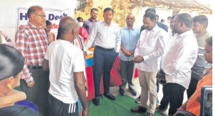
చేగుంట మండలం పాలంపల్లి ప్రజాపాలనలో దరఖాస్తులను పరిశీలిస్తున్న కలెక్టర్ రాజర్షిషా