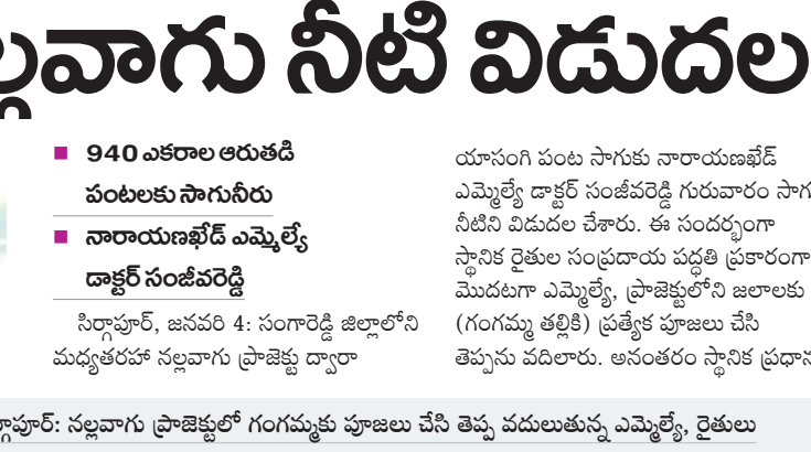
నిర్మాత: నల్లవారు ప్రాజెక్టులో గంగమ్మకు పూజలు చేసే తెప్ప వదులుతున్న ఎమ్మెల్యే రేతుల

పలు సూచనలు సలహాలు చేశారు. ఈ సందర్భంగా కలెక్టర్ రాజర్షిషా మాట్లాడుతూ.. ప్రజలు భక్తులకు అన్నదానం చేస్తున్నాం. భగవాన్ శ్రీరామచంద్రుడి కృప కటాక్షాలతో అయోధ్యలో 45 రోజుల పాటు అన్నదాన వితరణ చేసే భాగ్యం కలిగింది. ఇది ఎన్నో జన్మల పుణ్యఫలంగా భావిస్తున్నాం. భగవంతుడు ఇచ్చిన శక్తి మేరకు మా కార్యక్రమాలు ఏటా కొనసాగిస్తాం. సామాజిక సేవలో ఉన్న తృప్తి మరెవరికీ దొరకదు.