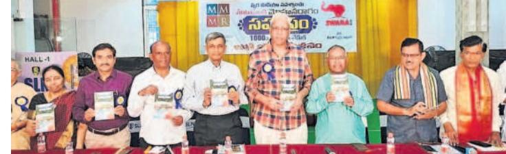
పుస్తకావిష్కరణ చేస్తున్న జయప్రకాశ్ నారాయణ, సీని నిర్మాత నర్సింహారావు

సిద్దిపేట, జనవరి 4 : అయోధ్య రాములోలి సన్నిధిలో అన్న దానం చేసే ఆరుదైన అవకాశం దక్షిణ భారతదేశంలోనే తొలిసారి సిద్దిపేటకు చెందిన అమర్నాథ్ అన్నదాన సేవా సమితికి దక్కింది. సుమారు 45 రోజులపాటు ఇక్కడ రోజుకు 5వేల నుంచి 7వేల మందికి అన్నదానం చేసే భాగ్యన్ని కల్పించారు. ఈ నేపథ్యంలో నమస్తే తెలంగాణ అందిస్తున్న ప్రత్యేక కథనం. 'అన్నం పరబ్రహ్మ స్వరూపం' అని ఆలోచిస్తే... అన్నిదానాల్లో కెల్ల అన్నదానం విశిష్టమైంది. 2011 నుంచి అన్నదానం చేస్తూ అనేక మంది యాత్రికుల ఆకలిని తీరుస్తున్న సిద్దిపేటకు చెందిన ప్రముఖ సేవా సంస్థ అమర్నాథ్ అన్నదాన సేవా సమితికి అయోధ్య రామమందిరంలో రామ చంద్రస్వామి విగ్రహ ప్రతిష్ఠ కార్యక్రమం ఈ నెల 22న జరుగుతున్న నేపథ్యంలో అక్కడ అన్నప్రసాద వితరణ చేసే అవకాశాన్ని శ్రీరామ జన్మభూమి తీర్థ క్షేత్ర ట్రస్టు ద్వారా లభించింది. జమ్మూకశ్మీర్ లోని ప్రసిద్ధ మంచు లింగం అమర్నాథ్ యాత్రికులకు అన్నదానం చేసే లక్ష్యంతో సిద్దిపేటలో 2011లో ప్రారంభమైన అమర్నాథ్ అన్నదాన