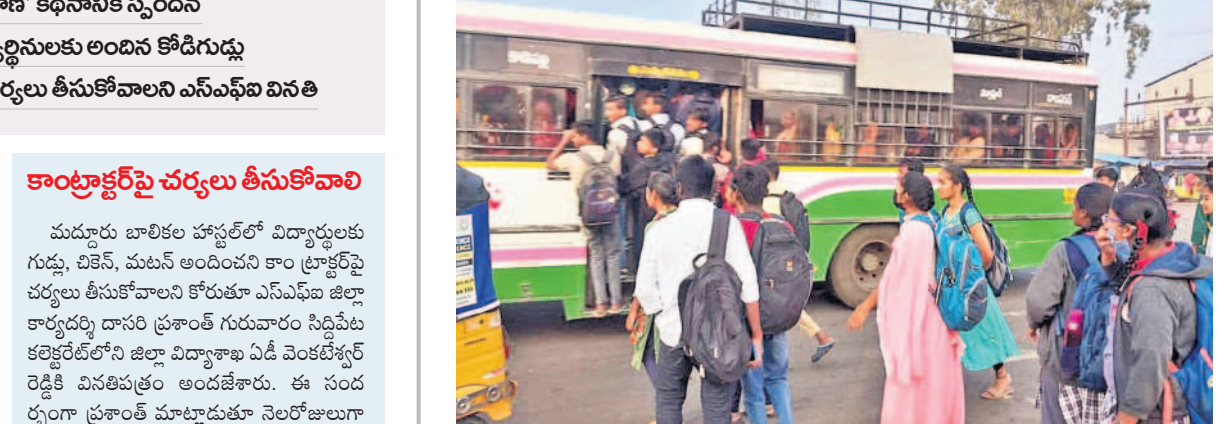
గుమ్మడిదల జాతీయ రహదారిపై బస్సుల కొరతతో పుట్టోర్లు ప్రయాణం చేస్తున్న విద్యార్థులు

మూలు అర్దులకు అందేలా కృషిచేస్తానని తెలిపారు. అన్నిశాఖల అధికారులతో సమన్వయం చేసుకుంటూ ప్రజాపాలన ద్వారా ప్రభుత్వ పథకాలు అమలు చేస్తామన్నారు. విద్య, వైద్యం, మహిళా సంక్షేమ కార్యక్రమాల అమలుపై ప్రత్యేకంగా దృష్టి పెడతానని తెలిపారు. ప్రశాంతంగా పార్లమెంట్ ఎన్నికల నిర్వహణ జరిగేలా చర్యలు తీసుకుంటానని నూతన కలెక్టర్ వల్లూరు క్రాంతి తెలిపారు. జిల్లాలో 18 ఏండ్లు నిడిన ప్రతిఒక్కరూ ఓటరుగా నమోదు చేసుకోవాలని సూచించారు. నూతన కలెక్టర్ గా బాధ్యతలు స్వీకరించిన వల్లూరు క్రాంతిని ఆదరణ కలెక్టర్ చంద్రశేఖర్, మాధురి, డీఆర్ఎం మెంతు నగేష్, డీఆర్ఎం శ్రీనివాస్, ఆర్టీవో రవీంద్రరెడ్డి, జిల్లా శాఖల అధికారులు, ఉద్యోగ సంఘాల నాయకులు కలిసి సన్మానించారు.