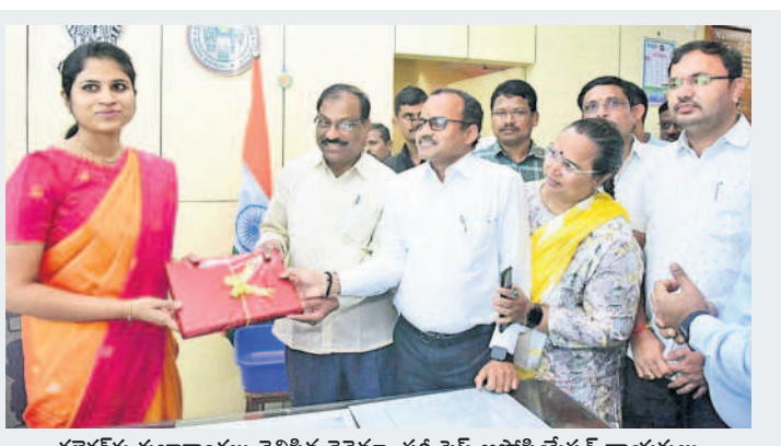
కలెక్టర్ కు శుభాకాంక్షలు తెలిపిన రెవెన్యూ సర్కిస్ అసోసియేషన్ నాయకులు