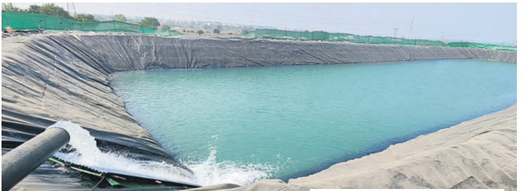
మంచినీటి కోసం ఏర్పాటుచేసిన సంపులోకి వదులుతున్న మిషన్ భగీరథ నీరు

పరిగి, జనవరి 4 : పరిగి పట్టణ శివారులో ఈనెల 6 నుంచి 8వ తేదీ వరకు మూడు రోజులపాటు ఇస్మేమా జరుగనున్నది. ఈ కార్యక్రమ నిర్వహణకు పరిగి మున్సిపాలిటీ పరిధిలోని న్యూమర్కెన్గల్ సమీపంలో 280 ఎకరాల్లో నిర్వహణకు అన్ని ఏర్పాట్లు చేస్తున్నారు. ఇస్మేమాకు తెలంగాణ, ఆంధ్రప్రదేశ్, కర్ణాటకలోని గుల్బర్గా, బీదర్ తదితర ప్రాంతాల నుంచి సుమారు 2 నుంచి 3 లక్షల వరకు ముస్లింలు హాజరు కానున్నట్లు సమాచారం. కార్యక్రమానికి వచ్చిన వారు కూర్చునేందుకు కు ర్మిలాతోపాటు భోజన వసతి కోసం 26 వంటకాలను ఏర్పాటు చేస్తున్నారు. మంచినీటి సదుపాయం కోసం ప్రత్యేకంగా మిషన్ భగీరథ ప్రైవేట్ లిమిటెడ్ డబ్బల్ డబ్బింగ్ చేసి నుంచి కార్యక్రమ నిర్వహణ స్థలానికి ఏర్పాటు చేశారు. వాహనాలను నిలిపేందుకు ప్రత్యేకంగా పార్కింగ్ కేం డ్రాల ఏర్పాటుతోపాటు మరుగుదొడ్లు, ఆరు ప్రత్యేక వైద్య శిబిరాలు అందుబాటులో ఉండనున్నాయి. ఈ నెల 6వ తేదీ శనివారం ఉదయం ఇస్మేమా ప్రారంభమై 8వ తేదీ సోమవారం సాయంత్రం ముగియనున్నది. ఈ కార్యక్రమం కోసం జిల్లా ఎస్పీ కోటి రెడ్డి పర్యవేక్షణలో సుమారు 500 మంది పోలీసులు బందోబస్తు నిర్వహించనున్నారు. ఇందులో ఇద్దరు ఆదనపు ఎస్పీలు, ఆరుగురు డివి ఎస్పీలు, పదిమంది సీబిలు, 30 మంది ఎన్ఐలు ఉండనున్నారు. కాగా ఇస్మేమా కార్యక్రమ నిర్వహణ, సదుపాయాల కల్పన కోసం ప్రభుత్వం రూ.2.45 కోట్లు మంజూరు చేసింది. మంచినీటికి సంబంధించి సంపు నిర్మాణం, ఇతర పనుల కోసం రూ.85లక్షలు, ప్రైవేట్ నిర్మాణానికి రూ.68 లక్షలు, రోడ్డు నిర్మాణం, పార్కింగ్ ఏర్పాటు కోసం రూ.40 లక్షలు, నిరంతర విద్యుత్ సరఫరాకు ట్రాన్స్మిషన్ లైన్ల ఏర్పాటు, ఇతర