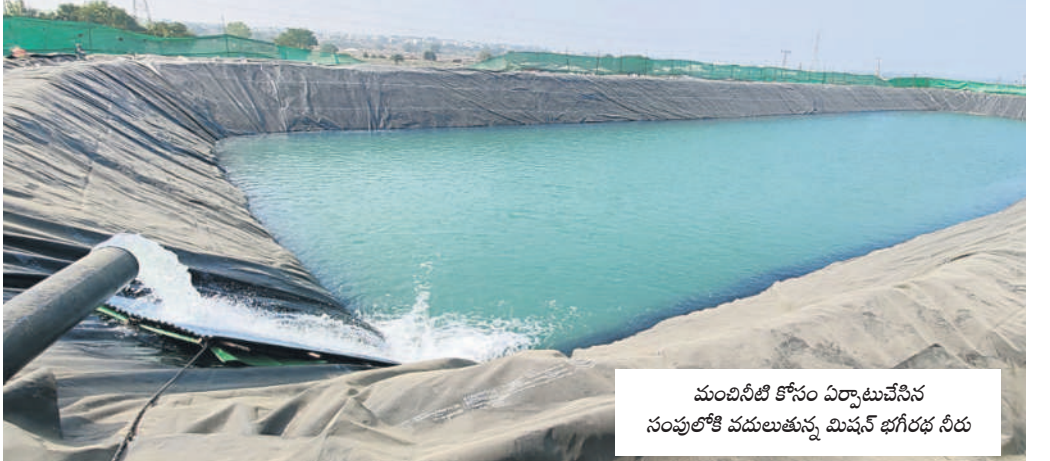
మంచివీటి కోసం ఏర్పాటుచేసిన సంపులోకి వదులుతున్న మిషన్ భగీరథ నీరు

పరిగి, జనవరి 4 : పరిగి పట్టణ శివారులో ఈనెల 6 నుంచి 8వ తేదీ వరకు మూడు రోజులపాటు ఇన్సైమా జరుగనున్నది. ఈ కార్యక్రమ నిర్వహణకు పరిగి మున్సిపాలిటీ పరిధిలోని న్యూపవన్ గర్ సమీపంలో 280 ఎకరాల్లో నిర్వహణకు అన్ని ఏర్పాట్లు చేస్తున్నారు. ఇన్సైమాకు తెలంగాణ, ఆంధ్రప్రదేశ్, కర్ణాటకలోని గుల్బర్గా, బీదర్ తదితర ప్రాంతాల నుంచి సుమారు 2 నుంచి 3 లక్షల వరకు ముస్లింలు హాజరు కానున్నట్లు సమాచారం. కార్యక్రమానికి వచ్చిన వారు కూర్చునేందుకు కు ర్మిలాతోపాటు భోజన వసతి కోసం 26 వంటకాలను ఏర్పాటు చేస్తున్నారు. మంచివీటి సదుపాయం కోసం ప్రత్యేకంగా మిషన్ భగీరథ ప్రైవేట్ లిమిటెడ్ డబ్బల్బ్రాండ్లను నుంచి కార్యక్రమ నిర్వహణ స్థలానికి ఏర్పాటు చేశారు. వాహనాలను నిలిపేయకు ప్రత్యేకంగా పార్కింగ్ కేం డ్రాల ఏర్పాటుతోపాటు మరుగుదొడ్లు, ఆరు ప్రత్యేక వైద్య శిబిరాలు అందుబాటులో ఉండనున్నాయి. ఈ నెల 6వ తేదీ శనివారం ఉదయం ఇన్సైమా ప్రారంభమై 8వ తేదీ సోమవారం సాయంత్రం ముగియనున్నది. ఈ కార్యక్రమం కోసం జిల్లా ఎస్పీ కోటి రెడ్డి పర్యవేక్షణలో సుమారు 500 మంది పోలీసులు బందోబస్తు నిర్వహించనున్నారు. ఇందులో ఇద్దరు ఆదనపు ఎస్పీలు, ఆరుగురు డిపీ ఎస్పీలు, పదిమంది సీఐలు, 30 మంది ఎన్ఐలు ఉండనున్నారు. కాగా ఇన్సైమా కార్యక్రమ నిర్వహణ, సదుపాయాల కల్పన కోసం ప్రభుత్వం రూ.2.45 కోట్లు మంజూరు చేసింది. మంచివీటికి సంబంధించి సంపు నిర్మాణం, ఇతర పనుల కోసం రూ.85లక్షలు, ప్రైవేట్ నిర్మాణానికి రూ.68 లక్షలు, రోడ్డు నిర్మాణం, పార్కింగ్ ఏర్పాటు కోసం రూ.40 లక్షలు, నిరంతర విద్యుత్ సరఫరాకు ట్రాన్స్ఫార్మర్ల ఏర్పాటు, ఇతర