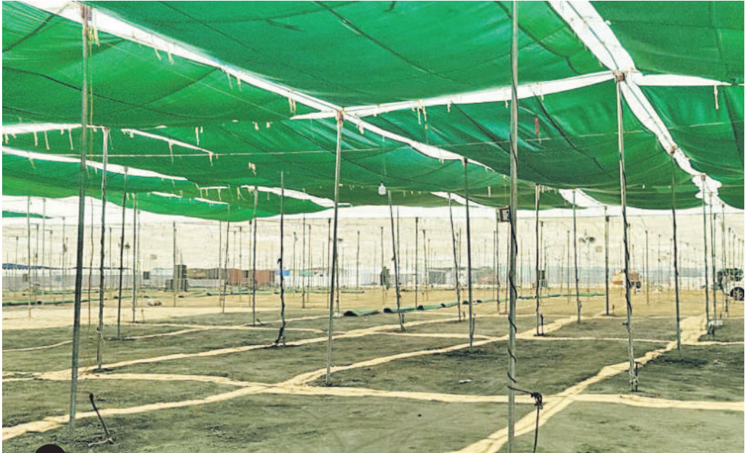
ఇన్సైమా కార్యక్రమానికి మరుగ్గా జరుగుతున్న ఏర్పాట్లు