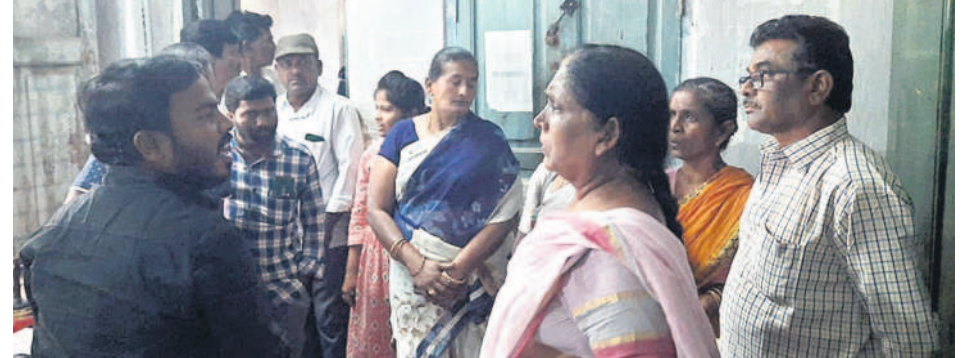
హిల్ కాలనీ హెడ్ పోస్ట్ ఆఫీసు వద్ద ఆందోళన చేస్తున్న ఖాతాదారులు