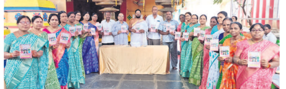
అధ్యయనోత్సవాల కరపత్రాలు ఆవిష్కరిస్తున్న భక్తులు

అధికారులు ఈ ఆపరేషన్లో భాగస్వాములుగా ఉన్నారు. జనవరి 31 వరకు తనిఖీలు చేపట్టి చిన్నారులకు విముక్తి కల్పించనున్నారు. జిల్లాలో ఇప్పటి వరకు 63 మంది యజమానులపై కేసులు నమోదయ్యాయి.