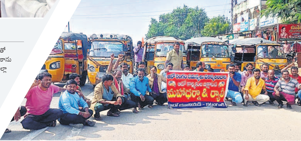
కట్టంగూర్లో ధర్మా చేస్తున్న ఆటో కార్మికులు