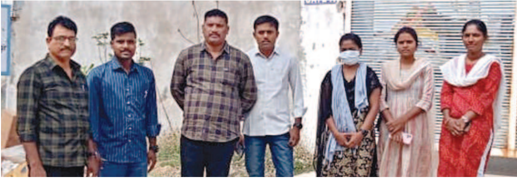
ఆపరేషన్ స్టైల్-10లో భాగంగా భువనగిరిలోని పాలిటామిక్ వాడలో తనిఖీకి వచ్చిన అధికారులు

ప్రతి సంవత్సరం జనవరిలో 'ఆపరేషన్ స్టైల్'ను నిర్వహిస్తుండగా యాదాద్రి భువనగిరి జిల్లా ఏర్పాటు తర్వాత చదో విడుదల చేపట్టారు. తప్పిపోయిన చిన్నారులను సాంతగూటికి చేర్చడం సహజ బాల కార్మికులను గుర్తించి ఆ వ్యవస్థ నుంచి విముక్తి కల్పించడమే దీని ప్రధాన లక్ష్యం. చదువు మధ్యలో మానేసిన వారు, యాచక వృత్తిలో కొనసాగుతున్న వారిని గుర్తించి వారిలో మార్పు తీసుకొస్తారు. భవిష్యత్తును మార్చడంపైనే దృష్టి పెడుతారు. వివిధ శాఖల అధికారులు సంయుక్తంగా తనిఖీలో భాగస్వాములవుతారు. ప్రధానంగా పోలీస్, బాలల పరిరక్షణ విభాగం, ప్రభుత్వేతర స్వచ్ఛంద సంస్థల సమన్వయంతో క్షేత్రస్థాయిలో పర్యటించి జిల్లాదే పడుతారు. జిల్లాను మూడు డివిజన్లుగా విభజించారు. భువనగిరి డివిజన్లో 8 మంది, చౌటుప్పల్ డివిజన్లో 8 మంది, యాదాద్రి డివిజన్లో ఏడుగురు