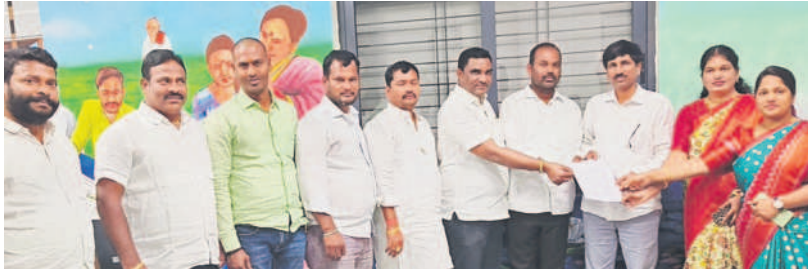
అవిశ్వాసం పెట్టాలని స్థానిక సంస్థల సూపరింటెండెంట్ కు తీర్మానం అందచేస్తున్న ఆదిబట్ల మున్సిపల్ కౌన్సిలర్లు

నగర శివారుల్లోని మున్సిపల్ కార్పొరేషన్లు, మున్సిపాలిటీల్లో అవిశ్వాసాల సీజన్ వచ్చింది. వాస్తవానికి చాలాచోట్ల ఏడాది, రెండేండ్లుగా మేయర్లు, చైర్మన్లు కార్పొరేటర్లు, కౌన్సిలర్లు గుర్రంగా ఉన్నారు. కానీ నిబంధనల ప్రకారం వారిపై అవిశ్వాసానికి అవకాశం లేకపోవడంతో ఇన్నాళ్లూ వారికి చేతులు కట్టే సీనట్లుగా ఉంది. కానీ ఈ నెలా ఖరీదైనా దాదాపు అన్ని స్థానిక సంస్థల కాలం నాలుగు సంవత్సరాలు దాట నుండటంతో తిరుగుబాటు వుటాకు సిద్ధమవుతున్నారని భాగంగా బడంగిపేట మున్సిపల్ కార్పొరేషన్, ఇబ్రహీంపట్నం, పెద్ద అంబర్పేట మున్సిపాలిటీలో అవిశ్వాసానికి ఇప్పటికే రంగం సిద్ధమైంది.