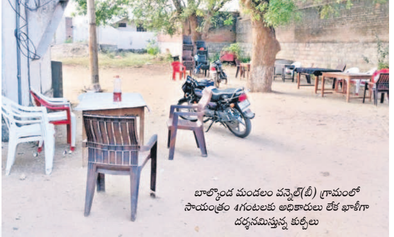
బాల్కనీడ మండలం వన్సెల్(బీ) గ్రామంలో సాయంత్రం 4 గంటలకు అభివృద్ధి లేక భారీగా దర్శనమిస్తున్న కుర్చీలు

ప్రజాపాలన అభివృద్ధి దరఖాస్తుల ప్రక్రియ కోసం ప్రజలెవరూ అదాయ, కుల ప్రవీకరణ వల్లాల కోసం మీ సేవల వద్ద బారులు తీరాల్సిన అవసరం లేదని నిజామా బాద్ జిల్లా కలెక్టర్ రాజీవ్ గాంధీ హస్తాంతం చేస్తున్నారని, రాష్ట్ర ప్రభుత్వ మార్గదర్శకాల మేరకు దరఖాస్తులకు ఆదార్, రేషన్ కార్డు జిర్కాల్ ఇన్స్పెక్షన్ సలహాకమిషన్లను పంపిస్తామని, చాలా మంది వదలకుండా సమీక్షించినట్లుగా ఇతరత్రా ప్రవీకరణ వల్లాల కోసం ఇబ్బందులు వదులుతున్నారని తమ దృష్టికి వచ్చిందన్నారు. ఏదైనా ప్రవీకరణ వల్లాల అవసరమైతే ప్రభుత్వమే ముందుగా అప్రమత్తం చేస్తుందని పేర్కొన్నారు. మీ సేవ కేంద్రాల్లో జరుగు తున్న దోపిడీపై నీలయస్గా దృష్టి సారాస్థాపనని చెప్పారు. నిర్ణీత రుసుములనే తీసుకోవాలని, ప్రజల అవసరాలను సామ్యు చేసుకుంటే కఠిన చర్యలు తీసుకుంటామని స్పష్టం చేశారు. ప్రజాపాలన దరఖాస్తుల ప్రక్రియ కోసం సాగుతున్నదని తెలిపారు. ఇప్పటి వరకు స్వీకరించిన దరఖాస్తులన్నింటినీ శుభ్రవారం నుంచే ఆన్లైన్లోకి డాటా ఎంట్రీ ప్రారంభించినట్లు చెప్పారు. జిల్లాలో మొత్తం 530 గ్రామ పంచాయతీల్లో సభలు పూర్తి చేశారు. ఆద్యార్, భీమగల్, బోధన్ మున్సిపాలిటీలు, నిజామాబాద్ నగర పాలక సంస్థల స్పెషల్ కమిషన్ల మొత్తం 148 డివిజన్/వార్డుల్లోనూ సభలు పూర్తి చేసినట్లు 'సమస్తే తెలంగాణ' ఇంటర్వ్యూలో కలెక్టర్ రాజీవ్ గాంధీ హస్తాంతం వివరించారు. -నిజామాబాద్, జనవరి 5 (సమస్తే తెలంగాణ ప్రతినిధి)