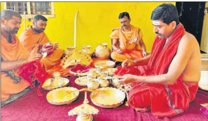
స్వామి వారి కల్యాణం, పూజా సామగ్రిని శుభ్రం చేస్తున్న లక్షకులు

చేర్కాల, జనవరి 5 : ఈ నెల 7వ తేదీన కొమురవెల్లి మల్లికార్జున స్వామి కల్యాణోత్సవం సందర్భంగా నిర్వహించే ప్రత్యేక పూజల వెండి తదితర సామగ్రిని ఆలయ అధ్యక్షులు సిద్ధం చేశారు. ఆలయ అధ్యక్షులు ఏటా ఆలయవర్గాలు స్వామి వారి కల్యాణోత్సవం ముందు రోజుల్లో వాటిని శుభ్రం చేసి స్వామి వారి నామాలు, పంచహారీ, రుద్ర పాదం తదితర వెండి, పంచహారీ సామగ్రిని ప్రత్యేకంగా పూజలు నిర్వహించిన ఆనం తరం ఆలయవర్గాలు సిద్ధం చేశారు.స్వామి వారి కల్యాణోత్సవం మొదలుకొని ఏకాదశ రుద్రాభిషేకం, లక్ష్మీకార్యాల తదితర పూజలు ఆలయవర్గాలు స్వామి వారి కల్యాణోత్సవం ముందు రోజుల్లో వాటిని శుభ్రం చేసి స్వామి వారి నామాలు, పంచహారీ, రుద్ర పాదం తదితర వెండి, పంచహారీ సామగ్రిని ప్రత్యేకంగా పూజలు నిర్వహించిన ఆనం తరం ఆలయవర్గాలు సిద్ధం చేశారు.స్వామి వారి కల్యాణోత్సవం మొదలుకొని ఏకాదశ రుద్రాభిషేకం, లక్ష్మీకార్యాల తదితర పూజలు ఆలయవర్గాలు స్వామి వారి కల్యాణోత్సవం ముందు రోజుల్లో వాటిని శుభ్రం చేసి స్వామి వారి నామాలు, పంచహారీ, రుద్ర పాదం తదితర వెండి, పంచహారీ సామగ్రిని ప్రత్యేకంగా పూజలు నిర్వహించిన ఆనం తరం ఆలయవర్గాలు సిద్ధం చేశారు.