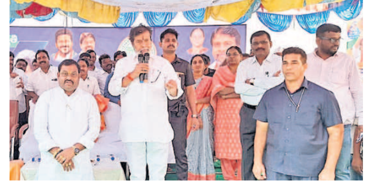
అందోల్ : జోగిపేటలో మాట్లాడుతున్న మంత్రి దామోదర రాజనరసింహ