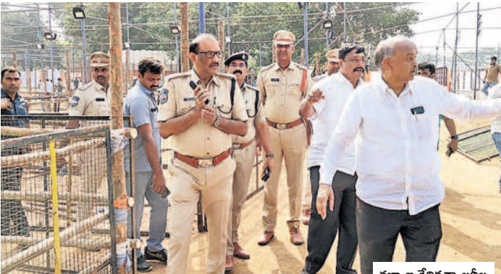
కల్యాణ వేదిక గ్యాలరీల వద్ద ఆలయ ఈవీ, అదీషనల్ డీసీసీ