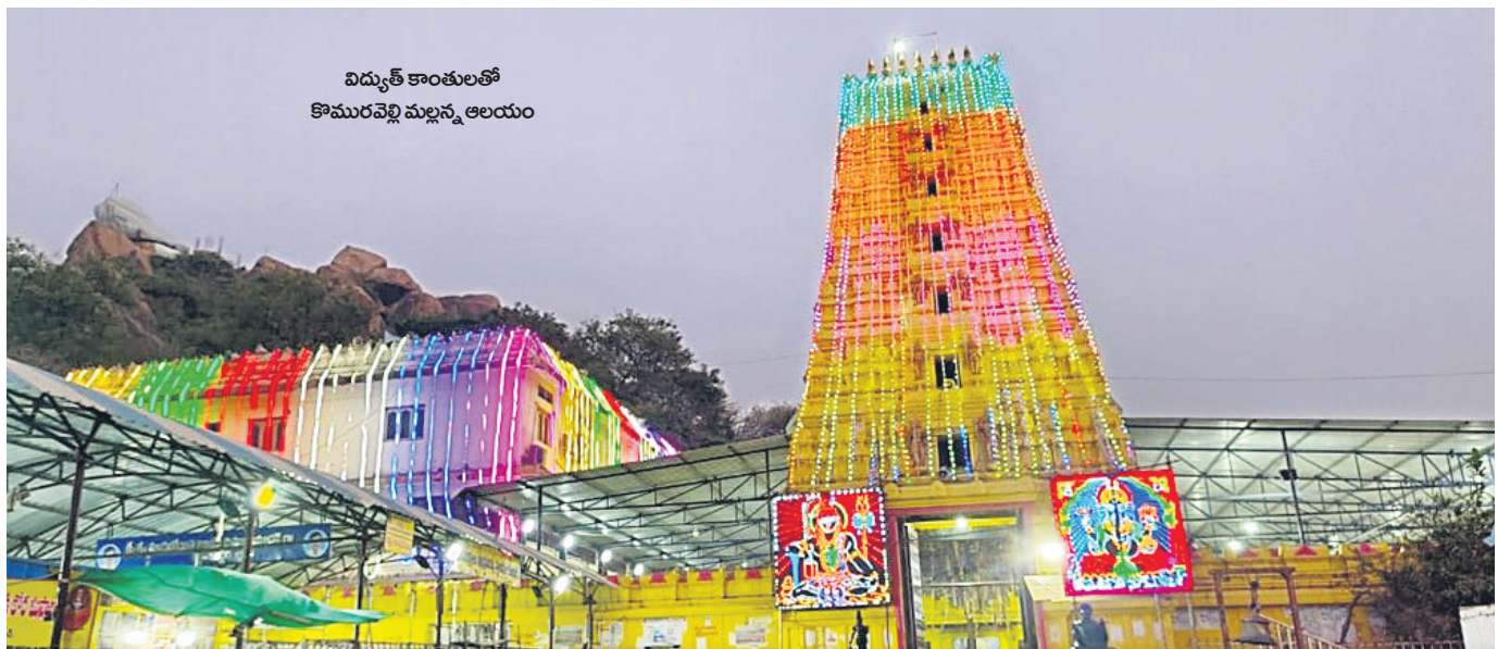
విద్యుత్ కాంతులతో కొమురవెల్లి మల్లన్న ఆలయం

స్వామి వారి కల్యాణోత్సవానికి 30 వేల మంది భక్తులు హాజరు