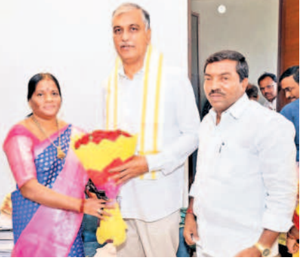
ఎమ్మెల్యే హరీశ్ రావుకు పుష్పగుచ్ఛం అందజేసి శుభాకాంక్షలు తెలుపుతున్న ఎంపీపీ లావణ్య అంజన్ గౌడ్

ములుగు, జనవరి 5 : నూతన సంవత్సరాన్ని పురస్కరించుకొని శుక్రవారం మాజీ మంత్రి, ఎమ్మెల్యే హరీశ్ రావుకు ములుగు ఎంపీపీ పెద్ద బాల్ లావణ్య అంజన్ గౌడ్ దంపతులు శుభాకాంక్షలు తెలిపారు. హైదరాబాద్ లోని ఎమ్మెల్యే నివాసంలో వారిని మర్యాదపూర్వకంగా కలిసి శుభాకాంక్షలు తెలిపారు.