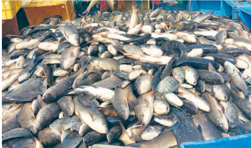
అరవపల్లి : బొల్లంపల్లి గ్రామంలోని ఒట్టెకుంట చెరువులో పట్టిన చేపలు

కాశేశ్వరం జలాల రాకతో జిల్లాలో నీలి విప్లవం ఊపందుకుంది. కేసీఆర్ ప్రభుత్వం మిషన్ కాకతీయలో భాగంగా చెరువులను పునరుద్ధరించగా ప్రస్తుతం అవి వేసవిలో సైతం నిండుకుండను తలపిస్తున్నాయి. దానికీ తోడు ప్రభుత్వ సాయంతో మత్స్యకారులు విరివిగా చేపలు సాగు చేస్తున్నారు. కాశేశ్వరం ఆయకట్టు పరిధిలోని తుంగతుర్తి, కోదాడ, సూర్యాపేట నియోజకవర్గాల్లోని 10 మండలాల మత్స్యకారుల ఆదాయం ఏడేండ్ల క్రితం రూ.15కోట్లు ఉంటే ప్రస్తుతం అది రూ.114కోట్లకు చేరడం విశేషం.