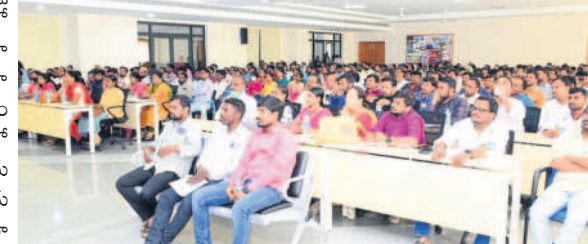
హాజరైన అధికారులు, డాటా ఎంట్రీ ఆపరేటర్లు

సంబంధిత దరఖాస్తుపై తప్పనిసరిగా రాయాలని సూచించారు. డాటా ఎంట్రీ చేశాక మీకిచ్చిన దరఖాస్తులను తిరిగి జాగ్రత్తగా సంబంధిత సూపర్వైజర్లకు అందించాలని తెలిపారు. శిక్షణ కార్యక్రమంలో వివిధ శాఖల అధికారులు, డాటా ఎంట్రీ ఆపరేటర్లు పాల్గొన్నారు.