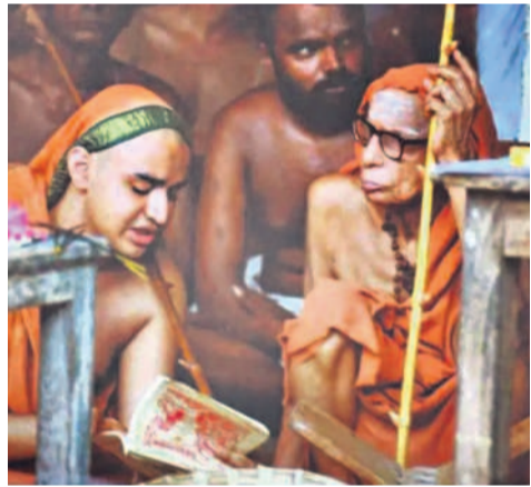
విజయ యాత్రలో భాగంగా దేశమంతా పర్యటిస్తున్నారా కదా! ఈ క్రమంలో మీరు గమనించిన భారతీయ ఆధ్యాత్మిక వైభవం గురించి ప్రస్తావించగలరా..

మన దేశ సంస్కృతి అంతా ఒక్కటే! అదే మన జాతీయత. సనాతన ధర్మానికి మనదేశం ఆలవాలం. ఇక్కడ కుటుంబ సంస్కృతి బలంగా ఉన్నది. వేదం పఠింపబడుతున్నది. దక్షిణాదిలో వేద విద్య మరింత విస్తృతం అవుతున్నది. గడిచిన ఇరవై ఏండ్లలో తెలంగాణలో వేద ప్రచారం గొప్పగా జరుగుతున్నది. వేద పాఠశాలలు, స్మారక పాఠశాలలు భాగా పెరిగాయి. తెలంగాణ ప్రభుత్వం కూడా ఆధ్యాత్మికతకు చేయూతనివ్వడం గొప్ప విషయం. ఉత్తర భారతానికి వస్తే.. అక్కడ భక్తి ఉంది. ఆసక్తి ఉంది. ధార్మిక విద్యా సంస్థలు తక్కువనే చెప్పాలి. గోసేవ విశేషంగా కనిపిస్తుంది. ఉత్తరాదిలో వేద విద్యకు మరింత ఊతమివ్వాలి. దక్షిణాదిలో గోశాలలు విరివిగా నెలకొల్పాలి. ఎక్కడ ఏది అవసరమో, అక్కడ దానిని మనం కల్పించాలి.