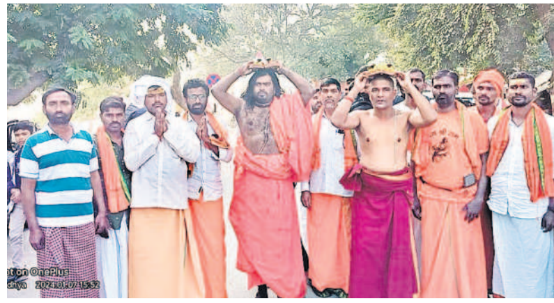
పాదుకలతో పాదయాత్రగా బయల్దేరిన స్వాములు