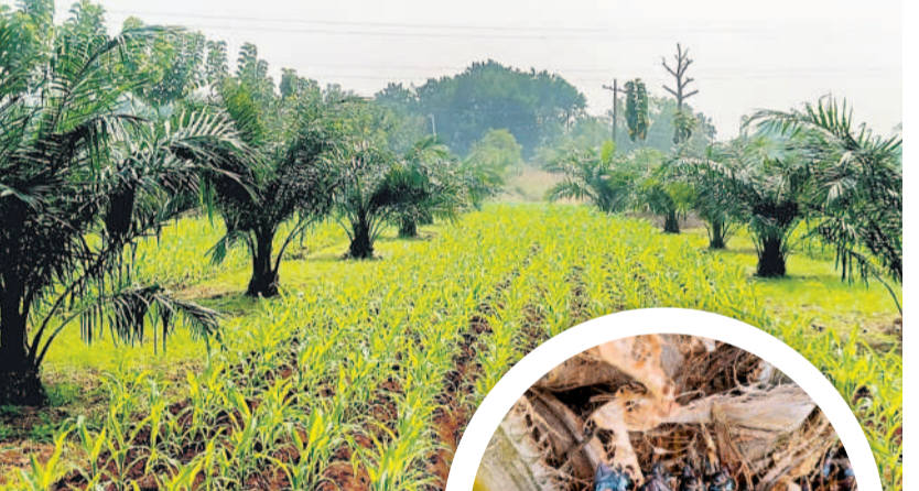
గుంటూరుపల్లిలో ఆయిల్ పాం మొక్కలకు వేసిన గెలలు

ప్రత్యామ్నాయంపై దృష్టిపెట్టిన రైతులు ప్రయోగాత్మకంగా సాగుచేసిన ఆయిల్ పాం పంట కాకకు వచ్చింది. మాదేశ్ క్షేత్రం ఎన్నో ఆశలతో నాటిన మొక్కలు పెద్దవై దిగుబడి మొదలవడంతో రైతుల్లో సంతోషం వెల్లివిరిసింది. గత కేసీఆర్ సర్కారు ప్రోత్సాహం, సబ్సిడీ అందించడంతో జిల్లాలో మొదటి విడుత 352.55 ఎకరాల్లో పంట సాగుచేయగా, ఇప్పటివరకు 3044 ఎకరాల్లో పంట సాగుచేయింది. అంతేకాక ఆయిల్ పాం తోటల మధ్యలో అంతర పంటతోనూ అదనపు ఆదాయం పొందుతూ లాభాల పంటలు పండిస్తున్నారు.