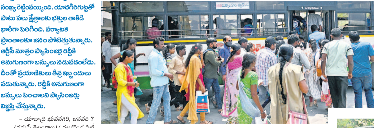
నల్లగొండ బస్టాండ్లో ప్రయాణికుల రద్దీ

ప్రయాణికుల రవాణాకు బస్సులు సరిపోవడం లేదు. మహాలక్ష్మి పథకం ఎఫెక్ట్ తో ఉమ్మడి జిల్లాలో ప్రయాణికుల సంఖ్య రెట్టేంపయ్యింది. యాదగిరిగుట్టలో పాటు పలు క్షేత్రాలకు భక్తుల తాకిడి భారీగా పెరిగింది. వర్యాటక ప్రాంతాలకు జనం పోటీపడుతున్నారు. ఆర్టీసీ మాత్రం ప్యాసింజర్ రద్దీకి అనుగుణంగా బస్సులు నడుపడంలేదు. దీంతో ప్రయాణికులు తీవ్ర ఇబ్బందులు బస్సులు పెంచాలని ప్యాసింజర్లు విజ్ఞప్తి చేస్తున్నారు.