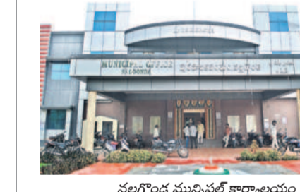
నల్లగొండ మున్సిపల్ కార్యాలయం

నల్లగొండ మున్సిపాలిటీలో 48 వార్డులకు టీఆర్ఎస్ 20, కాంగ్రెస్ 20, బీజేపీ 6, ఎంఐఎం ఒకటి, స్వతంత్రులు ఒకరు గత ఎన్నికల్లో విజయం సాధించారు. ఎంఐఎం, స్వతంత్రులు, ఎక్స్ ఓబీఎమ్లు సభ్యులతో కలుపుకొని అప్పట్లో టీఆర్ఎస్ చైర్మన్, వైస్ చైర్మన్ పదవులను దక్కించుకుంది. తరువాత కాంగ్రెస్ కౌన్సిలర్ మృతి చెందడంతో అనంతరం జరిగిన ఉప ఎన్నికల్లో టీఆర్ఎస్ అభ్యర్థి విజయం సాధించాడు. కాంగ్రెస్ నకు చెందిన మరో కౌన్సిలర్ టీఆర్ఎస్ లో చేరడంతో టీఆర్ఎస్ కౌన్సిలర్ల సంఖ్య 22కు కాంగ్రెస్ సంఖ్య 18కి చేరింది. శాసనసభ ఎన్నికలు నమ