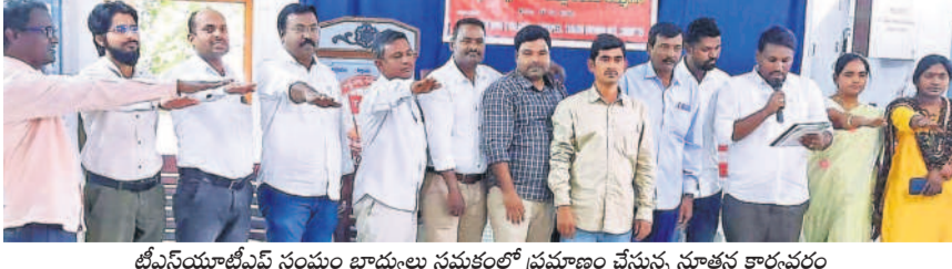
టీఎన్యూటీఎఫ్ సంఘం బాధ్యులు సమక్షంలో ప్రమాణం చేస్తున్న నూతన కార్యవర్గం