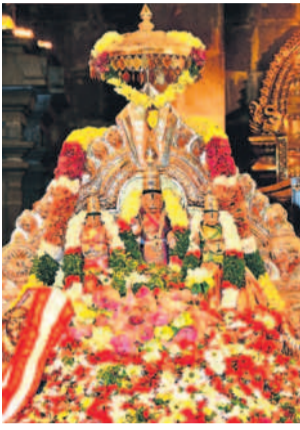
స్వామివారికి లక్ష పుష్పార్చన

యాదగిరిగుట్ట, జనవరి 7 : పంచ నారసింహ స్వామి దివ్య క్షేత్రం భక్తులతో కోలాహలంగా మారింది. ఆదివారం సెలవు దినం కావడంతో స్వయంభూ నారసింహ స్వామిని దర్శించు కునేందుకు భక్తులు అధిక సంఖ్యలో వచ్చారు. కర్పూరైస్తు, తిరు మాడవీడులు, ప్రసాద విక్రయశాల సందడిగా మారాయి. కొండపైకి వాహనాల రద్దీ పెరిగింది. నిత్య తిరు కల్యాణోత్సవం, సువర్ణ పుష్పార్చనలో భక్తులు సామికి సంఖ్యలో పాల్గొన్నారు. ఆదివారం వారి దర్శన దర్శనానికి 9 గం