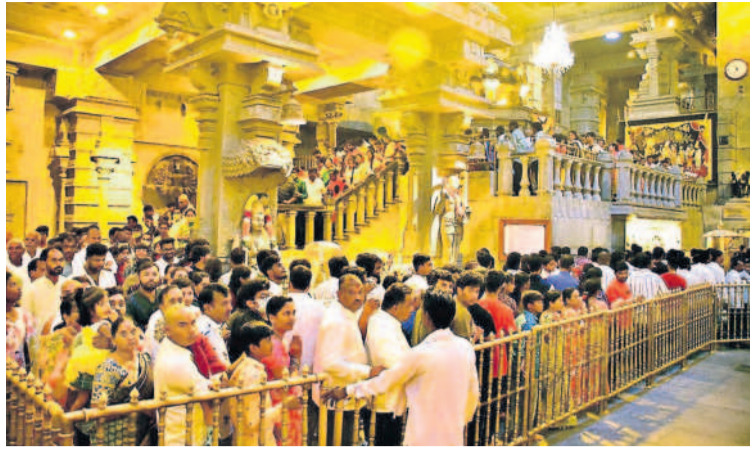
అక్షయదినం సామి దర్శనానికి కూర్చోనీ నిల్చున్న భక్తులు

యాదగిరిగుట్ట, జనవరి 7 : పంచ నారసింహ స్వామి దివ్య క్షేత్రం భక్తులతో కోలాహలంగా మారింది. ఆదివారం సెలవు దినం కావడంతో స్వయంభూ నారసింహ స్వామిని దర్శించు కునేందుకు భక్తులు అధిక సంఖ్యలో వచ్చారు. కర్పూరైస్తు, తిరు మాడవీడులు, ప్రసాద విక్రయశాల సందడిగా మారాయి. కొండపైకి వాహనాల రద్దీ పెరిగింది. నిత్య తిరు కల్యాణోత్సవం, సువర్ణ పుష్పార్చనలో భక్తులు సామికి సంఖ్యలో పాల్గొన్నారు. ఆదివారం వారి దర్శన దర్శనానికి 9 గం