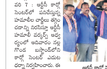
అక్షయ కార్గో సెంటర్ ఎదుట ధర్మా చేస్తున్న హమావీలు

నల్లగొండ సీటీ, జనవరి 7 : అక్షయ కార్గో సెంటర్లో పనిచేస్తున్న హమావీల చార్జ్ తగ్గించాలని నిరసిస్తూ అక్షయ కార్గో సెంటర్ ఎదుట ధర్మా చేస్తున్న హమావీలు పెంచాలింది పోయి తగ్గించడం అన్యాయమని వారు తెలుపారు. 30 సంవత్సరాలూ బస్టాండ్ లో సరుకులు ఎగుమతి దిగుమతి చేస్తూ తోపాడి వాటి పొందుతున్న కూలీలు ఆకలితో అలమటే సాధించి పరిస్థితి నెలకొంది పేర్కొన్నారు. గతంలో ఒక పార్టీలకు రూ.10 ఇస్తూ.. దాని బరువు పెరిగి