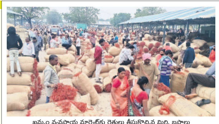
ఖమ్మం వ్యవసాయ మార్కెట్ కు రైతులు తీసుకొచ్చిన మిర్చి బస్తాలు

5 ఖమ్మం, మంగళవారం 9 జనవరి 2024 BHADRADRI KOTHAGUDEM