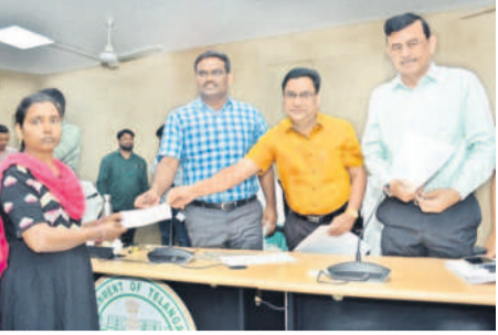
చెక్కు అందజేస్తున్న కర్ణాటక రాజీవ్ గాంధీ హాస్పిటల్