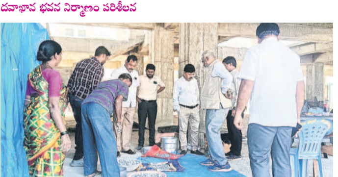
ఎల్లారెడ్డి వంద పడకల దవాఖాన నిర్మాణాన్ని పరిశీలిస్తున్న న్యూక్ బృందం సభ్యులు

ఎల్లారెడ్డి రూరల్, జనవరి 8: ఎల్లారెడ్డి పట్టణంలో చేపట్టిన వంద పడకల దవాఖాన భవన నిర్మాణంలో దవాఖాన పనులు సువిధంగా పునాది నిర్మాణం పూర్తిచేయడానికి న్యూక్ బృందం సభ్యులు సోమవారం పరిశీలించారు. నిర్మాణ పనుల్లో భాగంగా పిల్లల్లు, స్టాఫ్, ఫోర్మింగ్ లో వాడిన కంకర, ఇసుక, ఐరన్, సిమెంట్ శాతం, ఇతర సామగ్రిని పరిశీలిస్తూ నిర్మాణానికి అనుకూలంగా పరిశీలించారు. ఇసుక శాతం 50% కంటే ఎక్కువగా ఉండకూడదని నిర్మాణాధికారులు స్పష్టం చేశారు. ఇసుక శాతం 50% కంటే ఎక్కువగా ఉంటే ప్రాజెక్టును ఆపివేయాలని స్పష్టం చేశారు. ఇసుక శాతం 50% కంటే ఎక్కువగా ఉంటే ప్రాజెక్టును ఆపివేయాలని స్పష్టం చేశారు.