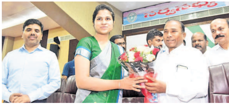
కలెక్టర్ కు శుభాకాంక్షలు తెలిపిన ఎమ్మెల్యే మాణిక్రావు