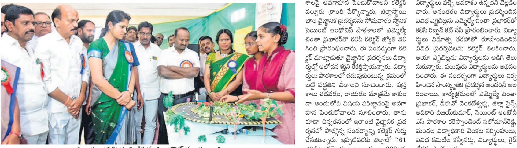
విద్యార్థుల ఎగ్జిబిషన్లు అతికట్టుకున్న జిల్లా కలెక్టర్ వల్లూరు క్రాంతి

సైజ్జానిక ప్రదర్శనలతో విద్యార్థులకు మేలు