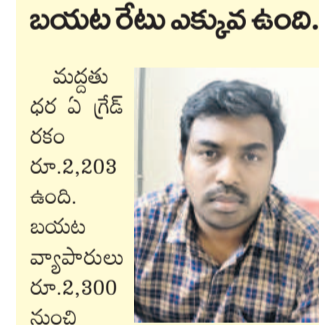
బయట రేటు ఎక్కువ ఉంది..

భద్రాద్రి కొత్తగూడెం, జనవరి 9 (నమస్తే తెలంగాణ) : ధాన్యం దళారుల పావుతుల న్నది. ప్రభుత్వం మద్దతు ధరకంటే బయట సన్నాల్కు రేటు పెరిగడంతో రైతులు వైచేమీ వ్యాపారులకి విక్రయాలు చేసేందుకు మొగ్గు చూపుతున్నారు. దీంతో సన్నాల్ కొనుగోలు కేంద్రాలు 89 కే పరిమితం అయ్యాయి. భద్రాద్రి జిల్లాలో ఇప్పటి వరకు 157 కేంద్రాల్లో కొనుగోలు జరగొచ్చి ఉండగా.. కేంద్రాల్లో మాత్రమే విక్రయాలు జరుగుతున్నాయి. ప్రతి ఏడాది వాసకాలం లక్ష మెట్రిక్ టన్నుల ధాన్యం కొనుగోలు చేయాలి ఉండగా.. ఈ ఏడాది ఇప్పటి వరకు కేవలం 12,768 మెట్రిక్ టన్నుల ధాన్యాన్ని మాత్రమే ప్రభుత్వం సేకరించగలిగింది. ఇంకా కొన్నిచోట్ల కొత్తలు ఆలస్యం అవడంతో మరో 25 వేల మెట్రిక్ టన్నులు వచ్చే అవకాశాలు ఉన్నట్లు అధికారులు చెబుతున్నారు.