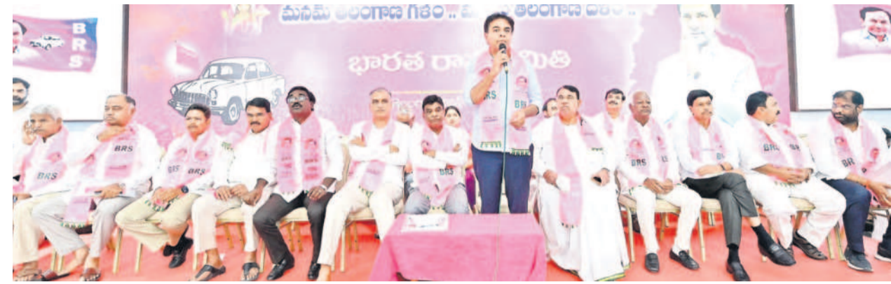
ఖమ్మం పార్లమెంట్ నియోజకవర్గ సమావేశంలో మాట్లాడుతున్న బీఆర్ఎస్ వర్కింగ్ ప్రెసిడెంట్ కేటీఆర్