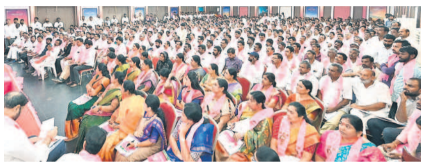
ఖమ్మం పార్లమెంట్ నియోజకవర్గ సమావేశంలో పాల్గొన్న బీఆర్ఎస్ ప్రజాప్రతినిధులు, నాయకులు

ఇంకా కొన్నిరోజుల పలు కారణాలతో సీట్లు కోల్పోయా మన్నారు. ఈ పరిస్థితుల్లో ప్రజల్లో ఉన్న అసంతృప్తికి కారణాలు చర్చించుకుని సమీక్షించుకొని ముందుకు సాగుదామని సూచించారు. రాష్ట్రంలో కాంగ్రెస్ ప్రభుత్వం ఏర్పాట్లై నెలదాటిందని, వచ్చిన తెలంగాణిం చే వ్యాగ్దానాలు అమలు చేస్తామని చెప్పిన కాంగ్రెస్ నాయకులు హామీల అమలులో కాలయాపన చేస్తున్నారన్నారు. ఇప్పటికే కాంగ్రెస్ ప్రభుత్వం పాల్పడ్డ ప్రజల్లో అసహనం ప్రారంభమైందన్నారు. ఇదిఇలాగే కొనసాగే చరిస్థితి ఉన్నదని, ప్రజల విశ్వాసాన్ని స్వల్పకాలంలో కోల్పోయే లక్షణం కాంగ్రెస్ పార్టీ సొంతమని, గత చరిత్రను పరిశీలిస్తే అర్థమయ్యేది కూడా అదేనన్నారు. 1983లో ఎన్టీఆర్ టీడీపీ స్థాపించిన అనంతరం రాజకీయ పరిణామాలను గమనిస్తే ఈ విషయం అర్థమవుతుందన్నారు. 1989 అసెంబ్లీ ఎన్నికల్లో టీడీపీ పార్టీని తిరస్కరించి కాంగ్రెస్ను గెలిపించిన ప్రజలు కేవలం ఏడాదిన్నర కాలంలోనే కాంగ్రెస్ పార్టీ మీద విశ్వాసాన్ని కోల్పోయారని గుర్తుచేశారు. ప్రజా విశ్వాసం కోల్పోయిన కాంగ్రెస్ అనంతరం జరిగిన నాటి లోకసభ ఎన్నికల్లో పాఠపాట్ల అమలు పాలయ్యిందని, ఆ ఎన్నికల్లో అదే ప్రజల పటిష్టత పీసీఐఐ భారీ మెజారిటీతో గెలిపించిన సంగతి మనం మరచకూడదన్నారు. ప్రజలకు ఇచ్చిన వ్యాగ్దానాలను నిలుపుకునే పార్టీగా తిరస్కరించలేదనడానికి గత నెలరోజుల ఎన్నికల అనంతరం పరిణామాలను పరిశీలిస్తే మరోసారి రుజువైందన్నారు. తెలంగాణ ప్రజల ఆకాంక్షలకు రాజకీయ ఆస్పత్రిగా నిలిచిన బీఆర్ఎస్