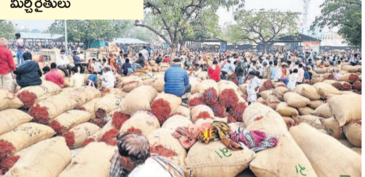
ఖమ్మం వ్యవసాయ మార్కెట్ కమిటీ కలెక్షన్లు తీసుకొచ్చిన మిర్చి బస్తాలు

ఖమ్మం వ్యవసాయం, జనవరి 9 : మార్కెట్లో మిర్చి ధరలు రోజురోజుకూ తగ్గుతుండడంతో ఆరు గాలం కష్టపడి వంట పండించిన రైతులు ఆందోళన చెందుతున్నారు. ఒక్క రోజులోనే తేజా రకం మిర్చి ధర క్వింటాకు రూ.500 తగ్గడంతో ఆయామయాలానికీ గురవుతున్నారు. ఖమ్మం వ్యవసాయ మార్కెట్లోని మిర్చి యార్డులో మంగళవారం ఉదయం జరిగిన జిందా పాలిలో తేజా రకం మిర్చి క్వింటా ధర రూ.20,500 పలికింది. సోమవారం ఇదే మార్కెట్లో క్వింటా ధర రూ.21 వేల పలికింది. సీజన్ ఆరంభంలో క్వింటా ఒక్కంబి దాదాపుగా