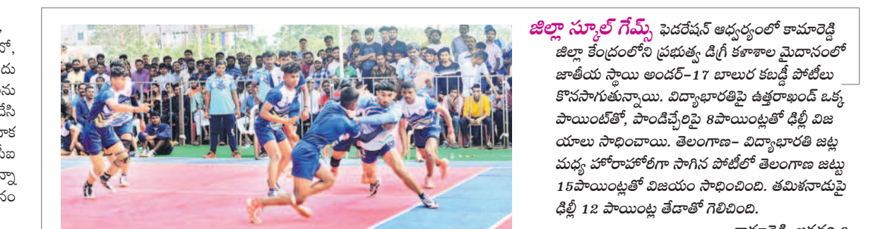
జిల్లా స్కూల్ గేమ్స్ ఫెడరేషన్ అధ్యక్షులతో కామారెడ్డి జిల్లా కేంద్రంలోని ప్రభుత్వ డిగ్రీ కళాశాల మైదానంలో జాతీయ స్థాయి అందర్-17 బాలుర కబడ్డీ పోటీలు కొనసాగుతున్నాయి. విద్యాభారతి జిల్లా కేంద్రం నుంచి వచ్చే ఫోన్ కార్డులకు సంబంధించిన ప్రజలను అప్రమత్తం చేస్తున్నారని, అత్యాచారం వివరాలు, ఫోన్ నంబర్, ఓపీసీ చెప్పినా సైబర్ సేకరణ గాజీ బ్యాంకు ఖాతాలోని డబ్బులను మాయం చేసారని హెచ్చరిస్తున్నారు. పౌర పాటున వివరాలు చెబితే వెంటనే పోలీసులను సంప్రదించాలని సూచించారు.