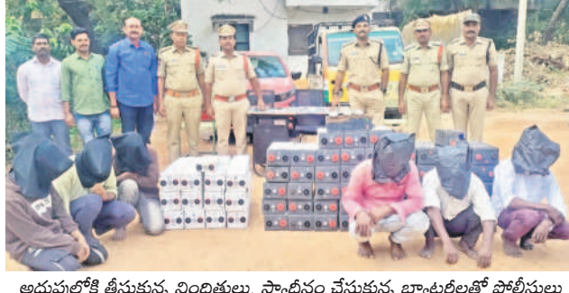
అడుపులో తీసుకున్న నిందితులు, స్వాధీనం చేసుకున్న బ్యాంకులలో పోలీసులు